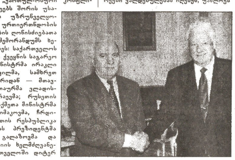
ხანში შექმნილი აუცილებელი პირობები სამართალდამცემი ორგანოების მუშაობისთვის აღნიშნული დანაშაულებების გამოძიებისა და დაშინებული პირთა მხარდაჭერის მიზნით.

ბით, უარს ამბობენ ძალის გამოყენებაზე ან ძალის გამოყენების მუქარაზე, ერთმანეთის მიმართ პოლიტიკურ, ეკონომიკურ ან სხვა ფორმით ზეწოლაზე. მხარეები დათანხმდნენ, გაატარონ ყველა ზომა, რათა აღიკვეთოს ნებისმიერი სამართალსაზღვრავი ქმედება, ეთნიკური ნიშნით აღძვრული უფლებების შელახვა, განხორციელდეს რეალური ღონისძიებები ლტოლვილებისა და გადაადგილებულ პირთა პრობლემების ღირსეული მოგვარებისთვის. მხარეებმა მოილოდინე, რომ შეიძლება კონფლიქტში მონაწილეობის შეწყვეტა, რამეთუ არ ჩაუვლია სამხედრო დანაშაული, აგრეთვე დანაშაული სამოქალაქო მოსახლეობის წინააღმდეგ, არ დაექვემდებარონ სისხლის სამართლის ძიებას. ამავე დროს, მხარეები ვალდებული იქნებიან, უახლოეს