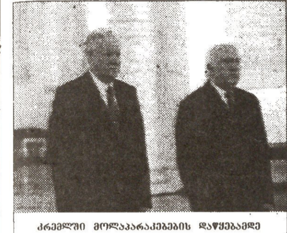
კრემლში მოლაპარაკებების დაწყებამდე

საქართველოს პრეზიდენტის ვიზიტი რუსეთში შევარდნაძის ვიზიტი რუსეთში. ვიზიტის მთავარი მიზანია რუსეთის სათათბიროსთან შეხვედრა. ვიზიტის მთავარი მიზანია რუსეთის სათათბიროსთან შეხვედრა. ვიზიტის მთავარი მიზანია რუსეთის სათათბიროსთან შეხვედრა.