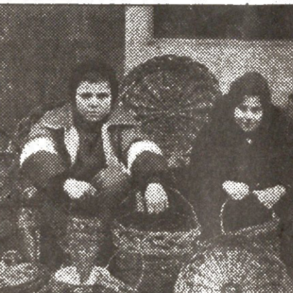
დღეს გვინდა ერთ გამოცდას შევიდეთ...