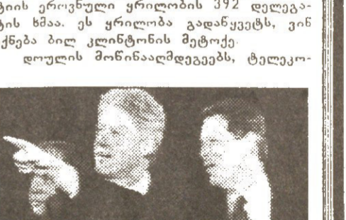
კლინტონი — გორი: ეს „ბიჭო“ კარგად „თამაშობს“

მენტორ პატრიკ ბიუენს და მულტიმილიონერ გამომცემელ სტივ ფორბსს, პრაქტიკულად, გა-მარჯვების არანაირი შანსი აღარ დარჩა. მიუხედავად ამისა, ისინი დარწმუნებულად საარქივოდ გა-ვარდნა არჩევენ. მათი პოლიტიკური კარ-ტივის ეროვნული ყრობის 392 დელეგა-ტის ხმა. ეს ყრობა დადასტურებს, ვინ იქნება ბილ კლინტონის მემკვი-დრის მონაწილეობა, ტელეკო-