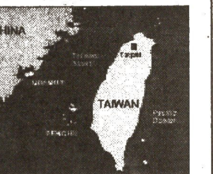
ჩინეთი და ტაივანი განაგრძობენ სამხედრო კონფლიქტის ზეარზე ბალანსირებას...