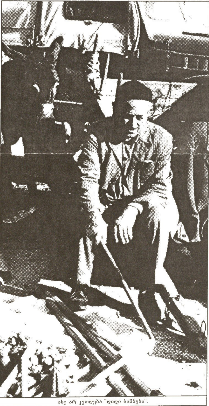
ასე არ კეთდება "დიდი ბიზნესი".

სრულ ხასიწარკეცეითებში ჩიკეპრადი წარმოვიდგენე.