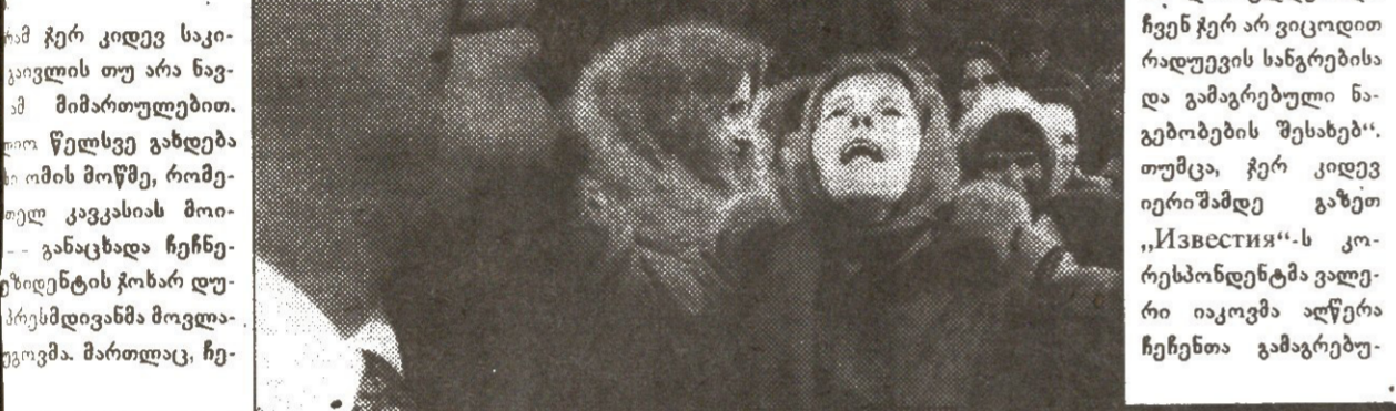
ჩეჩენი ბავშვები და მათი მშობლები, რომლებიც დატოვებული იყვნენ რუსეთის არმიის მიერ ჩეჩნეთში.