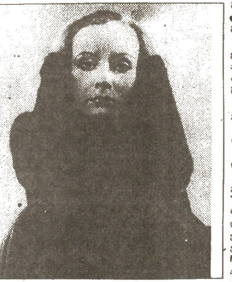
განცხადებ, ნადელს, რომელიც მუდმე ცხოვრებაში...