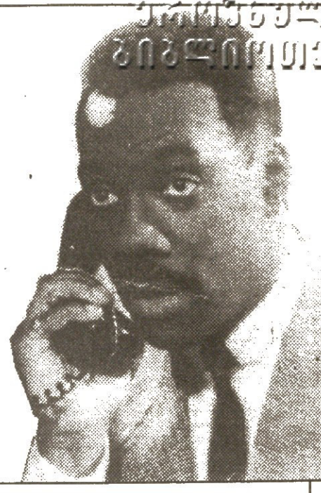
სახალხო დემოკრატიული პარტიის მდივანი...