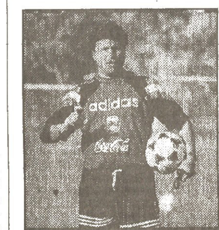
დელი და ციბერი კლავული კინება დაყენებინა...