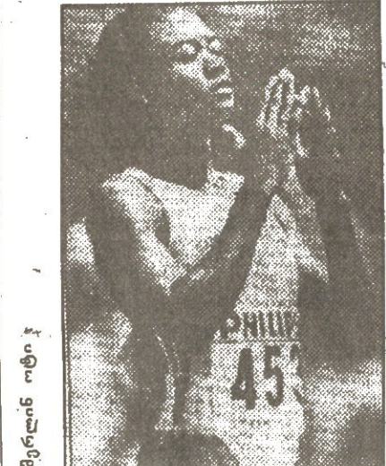
მეფა კოლეგია ოქროს მედალი აპრიკალს წა...