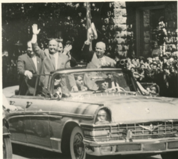
ს. ს. ხაჯიბეგოვი კლდედარის პარკში მისი ავტომობილი.

წარმართი ხალხის დიდი ნათელი დანახვების წინა დღეს თბილისის ჩამოვიდა ძვირფასი და სასწაული სწა- ბანი—საბჭოთა კავშირის ქოშინისწაი პარტიის უნდა- ღარი ქოშინების პირველი მღვდანი და სსს კავშირის პი- რისტიკა საბჭოს თავმჯდომარე ნიკოზა სარგის ძე ხაჯიბეგოვი.