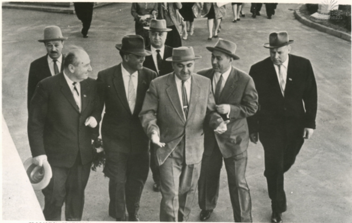
უზბეკეთის მმართველთა დელეგაციას მეთაურობდა უზბეკეთის კომუნისტური პარტიის ცენტრალური კომიტეტის პირველი მდივანი აბდულოვ ა. ა. კანდომოვი. მარჯვნივ სხა დელეგაციას—ზაქიკათის კომუნისტური პარტიის ცენტრალური კომიტეტის პირველი მდივანი ე. ა. კანდომოვი. სუბსკრიპციის მენეჯერი თაბილინი აბდულოვია.