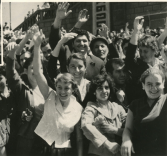
თბილისის მხარეთმცოდნეო ინსტიტუტის მეცნიერებანი სარგის ძე ხაჯიბეგოვი.

წარმართი ხალხის დიდი ნათელი დანახვების წინა დღეს თბილისის ჩამოვიდა ძვირფასი და სასწაული სწა- ბანი—საბჭოთა კავშირის ქოშინისწაი პარტიის უნდა- ღარი ქოშინების პირველი მღვდანი და სსს კავშირის პი- რისტიკა საბჭოს თავმჯდომარე ნიკოზა სარგის ძე ხაჯიბეგოვი.