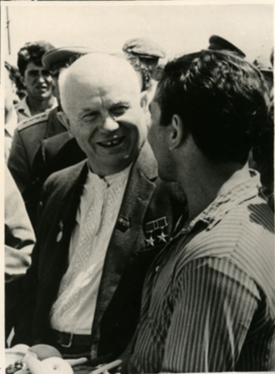
ქვიკიას სწავლას სიბაკა- ლით მხვდნენ ჟღერალთის აა- ნიონის სკოლა ქვეთითს ჟი- ბეკანომის წავაკი. საკათეგზე. ზემოთ—ს. ს. ხაშაკივი სკოლა ქვეთითს ჟილბეკანომიანი, მარჯვნივ— ს. ს. ხაშაკივი ქვეთითს ჟილბეკანომის ნაკრავანი- ჟონს რ. ქვეთითს.