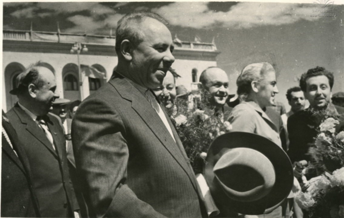
თბილისის პარკოვანაში ხვდებიან მოქმედი უკრაინის დელეგაციის ხელმძღვანელს, სსსს სენაკალაური კომიტეტის პრეზიდენტს ნიკოლოზ ნიკოლოზის ძეს, უკრაინის კომუნისტური პარტიის სენაკალაური კომიტეტის პირველ მდივანს ნ. ვ. კორნაჩენოს.