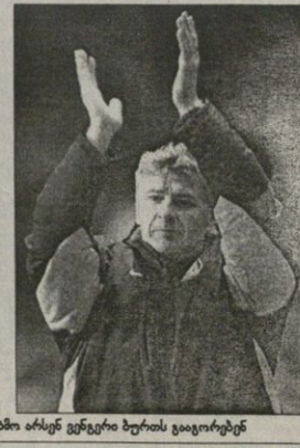
სამატიონი გუნდის ბოლო და უკიდურესი ოცნება ვიდეო კვირის გამოცხადებით