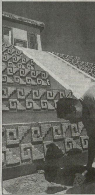
REUTERS სამ სალვადორიდან

მეღე მაიანის პირამიდებზე შავი იქნება. ეს პირამიდა საგანგებოდ წამოყენეს სან სალვადორის ფლორ მლანკის ერთგულ სტადიონზე, სადაც 23 ნოემბერს ცენტრალური ამერიკის XIX თამაშები გაიხსნება. თეიმისურ ცეცხლს კი სწორედ მაიანის პირამიდებზე ააბიჯებენ.