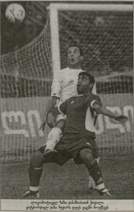
ლოკომოტიველ ზბა ჩანაბიასთს ქილილი ვიტორიოვლ ჰბა ბეჭის დღეს ვაქმა მოუქცეს

რაც საქართველოში ეროვნული ჩემპიონატი იმართება, საჩემპიონო ბრძოლას ასეთი ინტრიკა არ უქონია. თავდაპირველად, ათი სეზონის მანძილზე თბილისის „დინამოს“ სულ ორჯერ გამოუჩნდა პირველობის მოცილე — ჯერ „სამტრედიამ“ და მერე ზესტაფონის „მარგვეტი“. ოლონდ ეგავა, ეს გუნდები „ერთნოლიანები“ აღმოჩნდნენ. მერე ნამოჩიტდა ქუთაისის „ტორპედო“. შარბან ჩემპიონობაზე პრეტენზია თბილისის „ლოკომოტივმა“ განაცხადა. ზოგადად ჩემპიონატის ხარისხისა და ჩატარების პირობებზე რა მოგახსენოთ, მაგრამ ინტრიკა კი გაჩნდა.