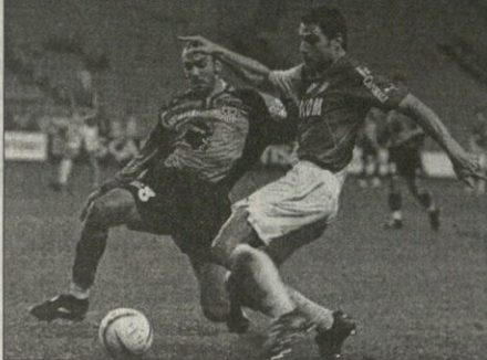
ათაბოლო პოლიედ რეგერენი (მარცხენა) და მონაქველი გასილის ზაფისი