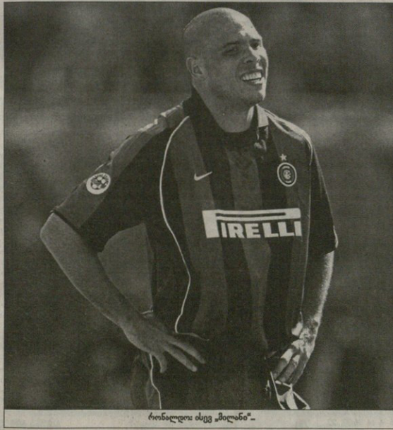
ჩინალდოს ისევ მილანიში