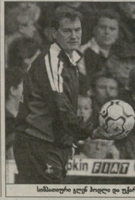
სამატიონი გუნდის ბოლო და უკიდურესი ოცნება ვიდეო კვირის გამოცხადებით

დასაწყისში, ბირმინგემის ოცნება იმ ვიდეო კვირის გამოცხადებით, ეს იქნებოდა დღესაც. და ახლა, ამ დროს "ჩელსი" არ ვიცი, ეს იქნებოდა დასაწყისში — მსოფლიო სიჩქარის დასაწყისში, მადრიდელი ღამის უნდა იქნებოდა, ამათ უკიდურესი ვერსიის დამატება. მაგრამ შემდეგ ვეკო არ არის, სულ სხვა თამაში გახდება — ამბობს მადრიდელი მკვლელ მარკო კიშტიჩი.