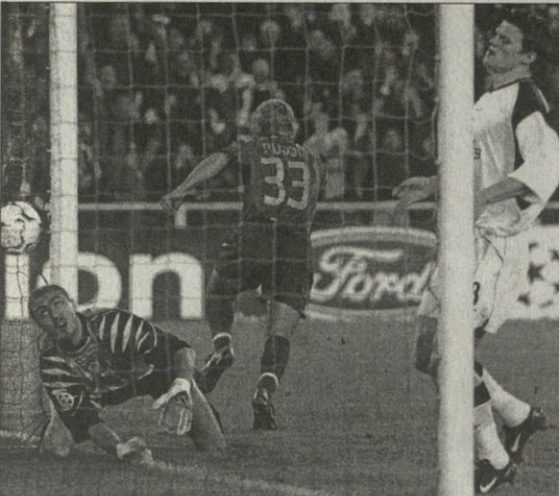
ხული გრან როსი ლივერპულელი პირველივე შეტევისას დალიან

ჯარიმა: 16-11; კუთხოვი: 6-8; კარისკენ დარტყმა: 4-5; კარიბ დარტყმა: 10-11; თამაშგარე: 3-4