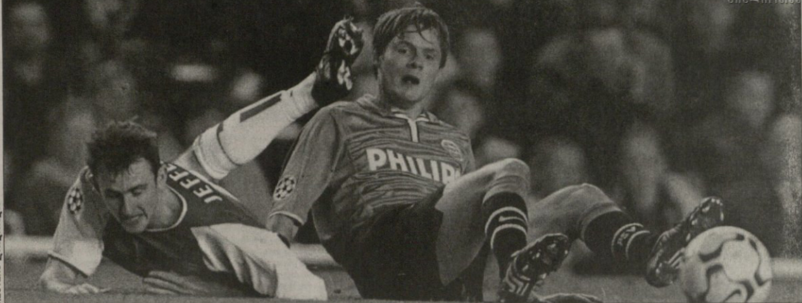
მასბინდო ფრენის წვერის და სტუმარი ოზან ფოცაო