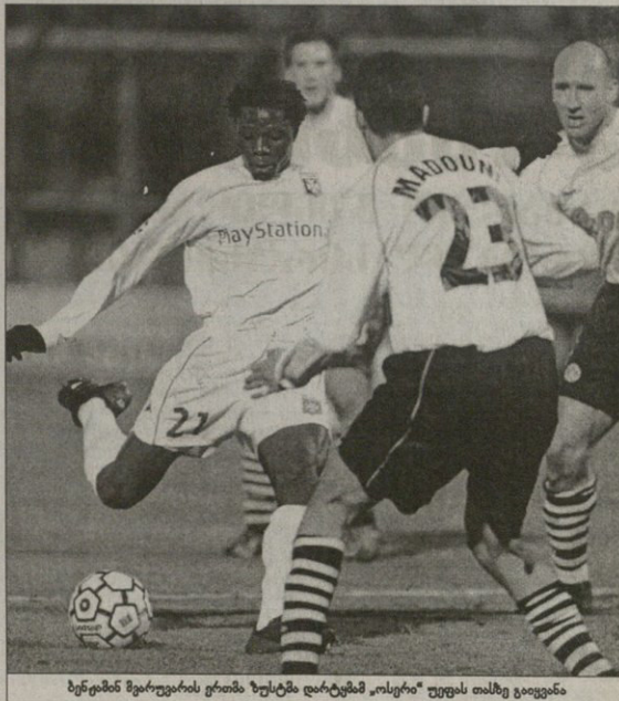
ბენგემ მყარბრების ერთი ზუსტმა დარტყმამ „ოსტარი“ უფეს თახზე გაიფინა

როი თამაშში და მინაც ვაუგაროლა. „ოსტარი“ უფეს თახზე ვადაინცილებს, რაც ფრანგებისთვის ერთობ წარმადებული შუდევა სეხინის წინ ხომ მათ ეველა ჯგუფში მეთიხე აფილზე ჩარნას უწინწარმბედეველა თუცე მსოციანი ვი რუს დამობილილმა ვერნის საკო-თარი თავს აუბა. დორტმუნდი“ კო ამივიანი ნაღდავად ამო-ხინა და ბოლი ტურნიშო მხოლოდ მოკლეობის მოხილს მინათლია თუ ვავედა მოქცევა. მათას ზამერის ვერცხეც ვერაგენ გამბეუტეს — ამ ეტაპზე მონანი მალწეული იყო, წინ კო ვრცლად და მძიხე სეხინა. შენახეთ თავა, ვისაც შევილიათ — აბამ ზალამბინი საბოლოო ცხრილი პუნტები არსენალი 6 3 1 2 94 10 დორტმუნდი 6 3 1 2 87 10 ოსტარი 6 2 1 3 47 7 სეც ინტელიგენცია 6 1 3 2 58 6 „არსენალი“ და „დორტმუნდი“ მყარბრები მურეც ვატარე „ოსტარი“ უფეს თახზე