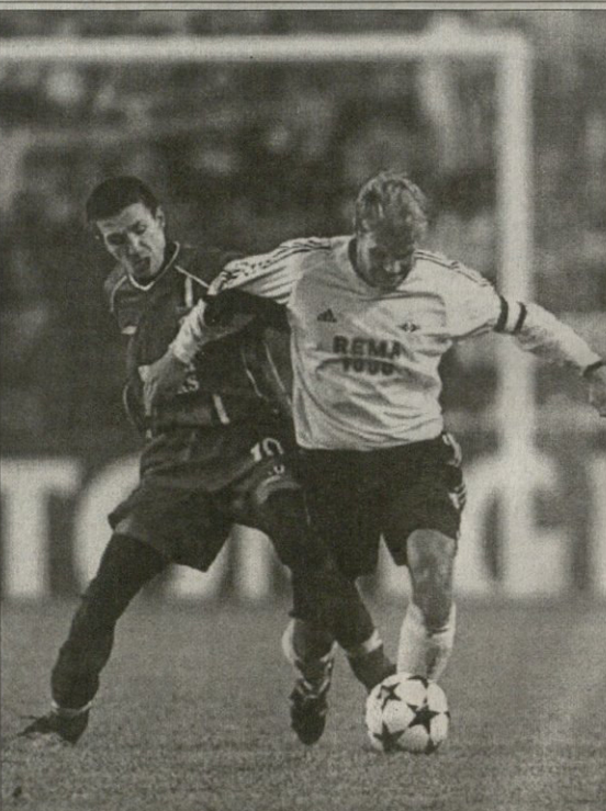
ტონი ვისი აბფსონია? მთავარი საკითხი მასზე მეცაა...