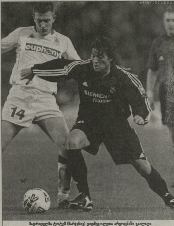
მადრიდელმა ტრეტემ (მარჯვნივ) დიდგოლითი აიგოვინა ბიშკის კარში

ბიშკი უნიტინგ, ოლინ ბოლი დარტყმის შესრულებაში რაღაც ხელს უშლიდა. ტრეტემ კი ასე შეაღწა ლუმი ფიფე კოუზური ჩანაწერა, ფრანსისკო პავინმა ბურთი თავით კარის გასწვრივ გადაადგო, ბოლი ჩემპიონთა ლიგის დებიუტანტმა ახლიდან არ დარტყმა შეეძლო. უნდა აღინიშნოს, რომ ჩემპიონთა თასის ცხრავის მიმდებარე "გეტეს" საჯარიმო მოედანი მადრიდელს არ დაუწყოკნება. თურცა, მორე ტაბის დასაწესში ფრანსილი მორინტეჟმა ჩანაწერი შესაძლებლობა გაუშვა ხელდან — ძელს გაატყა ბურთი საპოლიოლ კარული, ზინდინ ზიდანის და ორნალოს აროგანმა "რეალს" მისთვის ჩვეული შეტევა ბი ვერ განახორციელა. მოგესწვებათ შაბათი მადრიდელს, ესპანეთის პირველობაზე კარგი ვალკანოს! მოგეს, მგრამ იმ შესაძლებლობიდან ვინცტე დელ ბისკი მხოლოდ მათი ფეხბურთელი რობერტო კარლოსი, ლუმი ფიფე და ფრანსილი იერი დარტყმა. მორე ტაბის ბურთის ძირითადი "გეტე" ფლიბლა, თურცა მგარე სესარის კარიმ ბელგიელებმა მოხდნენ სამეფო დარტყმის, აქედან ერთხელ ზუსტად.