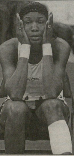
ვენის ულიამსი მუხილამ ტრამეიმ კი დასისტრისთან შეეკეთა