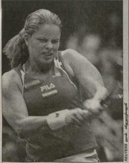
REUTERS ლოს ანჯელესიდან

ეს სერენასა და ელენას მესამე შეხვედა იყო და სამივეს მომბების გამბოვლა არ გაბეგინდებოდა იბი კი 29 ტურნირი შეეგება წილეუს მხოლოე ვერობილადე მიუქნეს ამამ