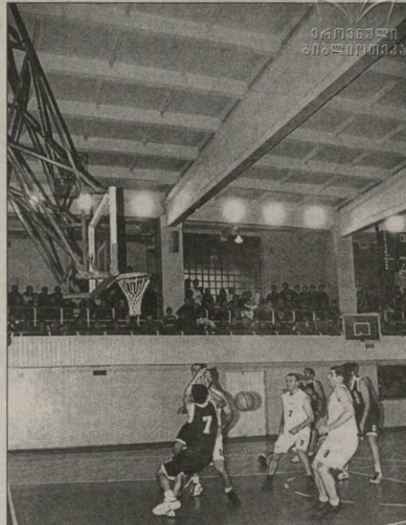
რუსთაველა განახლებულ დარბაზში პირველი სტუმარი და ამოტესტირებული მსგავსი სტუმარი