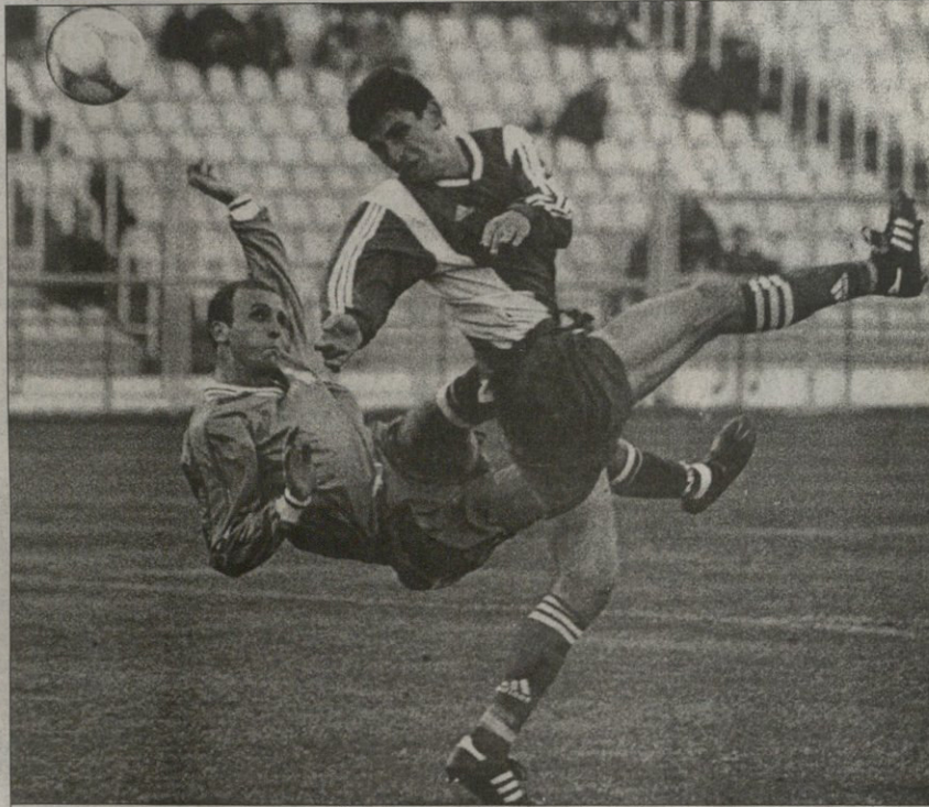
ლოკომოტივი — დინამო 1:0. რატო აღეშთებ მოხდენილად, მაგრამ უმედეგოდ დაარტყა

ასეი დროს თვალი და ვერი ფეხბურთისგან გეგუზავს და მის ვაქსელტობებს ვლით თითქოს ცველიერი მარცხადა — დებულეს უფლო და თამაშურებს კლუბის ჩემპიონატად მოკვთას თხოვს, რაც საქამთი არც უნდა იყოს, მაგრამ ხეობის წესობად ვრანსრულების ზერე ხომ ქართული ფეხბურთის წინსვლაზე ლამაზი უჩრებული ვახლბა? არადა დევილებს დაცვა ქართული ფეხბურთში მოსაქმებს მხოლოდ კაბინის პატეისტებს თუ აძილებს, თორემ გამოხდა სულაც არ უნდა.