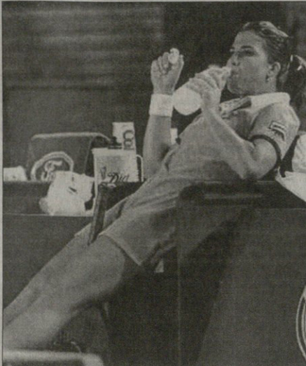
ლოს ანჯელესიდან