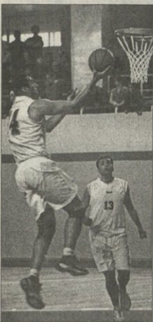
თბილისის ლეგენდარული ბასკეტბოლისტი ვლადიმერ ბერიძე