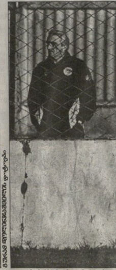
მინორი დეპრესიონალიზმზე ფიქსირება