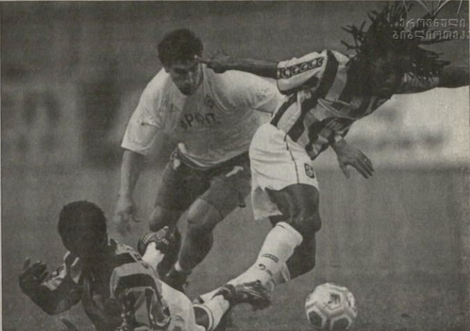
ვინცა — ვერდერი მასპინძელს რამაში მუტაგამ ფარვა ეგნალი და პოლ სტალტერის გიტეა