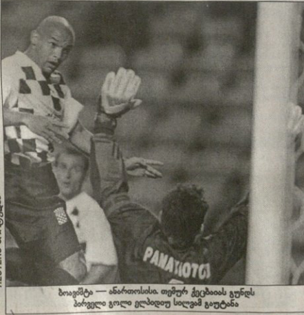
ბოიკეტი — ანაბოლისა თურქ ქველამი ვანსს ბიეგელი ვილი ვილკომ სილამ გუტეანი