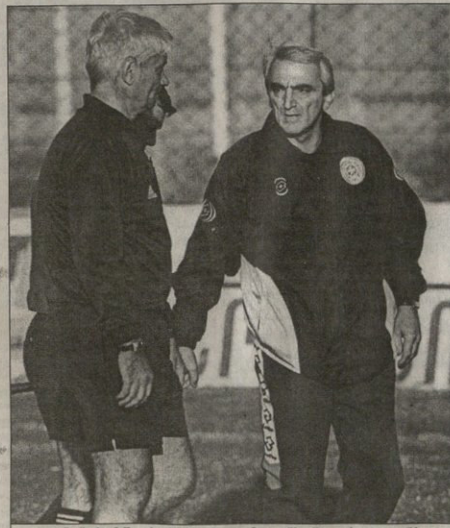
ალექსანდრე შუტოვის ოთარ გაბელია მოედანზე შეფერავდა და ვინაღაც კლასიკოსებს შიშმა აღიზინეს