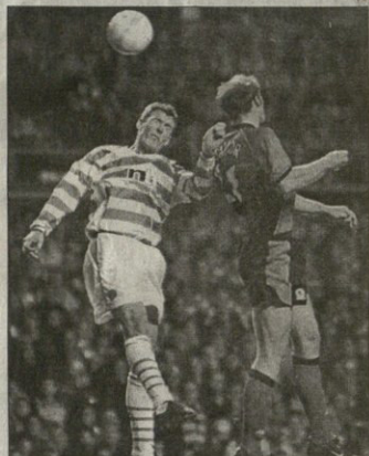
სელტიკი — ბრეშანი გლობელი კრის სტილი და დივიდო ვიგორა (მსაფინელი) ბრუნოსთვის შემართულან