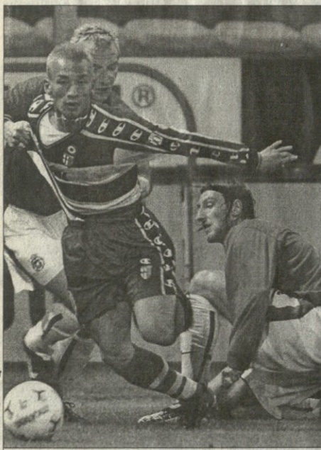
პარტი — ვსე. ბიფიკოში ნიკოლაიშვილი კრიაივალდის მისი მისურბე დამევა დისკორილი