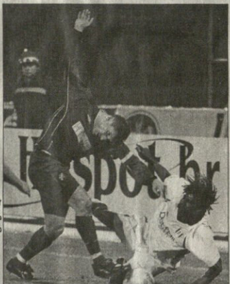
დინამო — ვუდვუმი მსაფინელი კაბრანი სილივი მარტი და ლინდინელი რუმინ ბრეტო