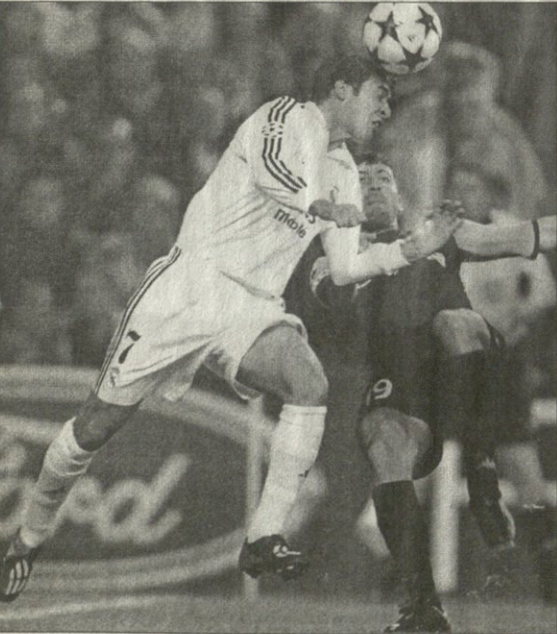
ბოლის ვალტერი სიმეღმა ვასაჭანი არ მარსე