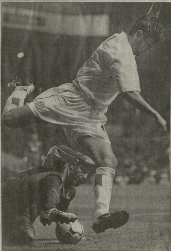
ლდისი — პაპილი. ერთი ბაქემ მეტოქეს კი გადაურა, მაგრამ „ლდისმა“ 1:0 იგმარა