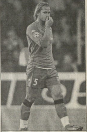
მეჭმის გადგების მერე ოსარს სპეც კულდ წოვიდა

რობინი იწინა , ასე ეწოდება "გამონივრებულ" აქამდე ბოლო ადგილზე მყოფ რუტელ პოლანდელს ფრანკო ოსარს! ჩაიფიცეს ხელში და დიდი ანერჯიით დაიარეს, თუმცა სანამ ფრანკი სრულ შემადგენლობით გრინდენ, ბევრი ვერაფერი დაეკუს ასე მხოლოდ 26-ე წუთამდე გაგრძელდა მერე კი დანიელი კრულ-ტივ ფსკენმა შექსენს აუთო წითელი ბარათი რასაც მერე ტაიმში ოლვერ კაპოს გადავება მოჰყვა მასხინობი კი უკვე 2-0 იტვირთ ბრუნკის და რომელის ვიდეო.