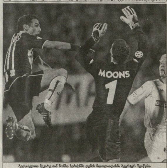
ბელგიელი შეგარე თან მონისი ბერძენმა დღის ნიკოლაიდისმა ბეგეჩერ შეჲგო