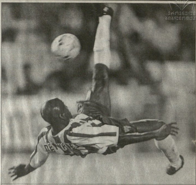
მსაფი — ატილი პინაშო. მსაფინელი დილი ვალდის დარტყმა მართლაც ლამაზი გამოუვიდა