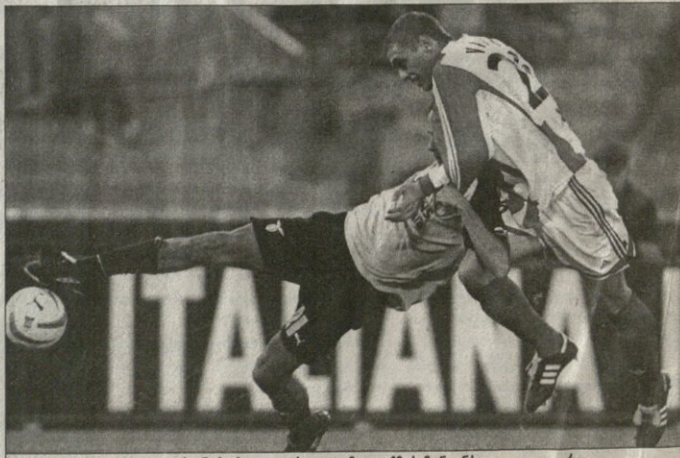
ლიცი — კრენა ზემბე. ბრუნოსთვის გლობელი სილივი მარტი და დივიდო ვიგორა (მსაფინელი) ბრუნოსთვის შემართულან