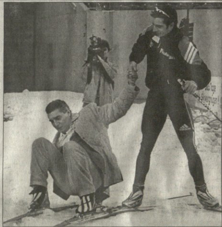
REUTERS ბელ ზუციონიდან

ფეხბურთის კაცს თხილაძურებზე რა უნდა: „შალკე 04“-ის მეტეჯერ რუდი ასაურის წამოდგომაში ბიატლონის თლიმბიური ჩემპიონი რეიკ გროსი შევლის. ასაურე დასწრება „შალკე არუნაზე“ გამართულ საბიატლონი ვარჯიშს. ამ არუნაზე საახალწლოდ ბიატლონის მსოფლიო გუნდური შეჯიბრი გაიმართება, რომელშიც თლიმბიური მედალოსნები და მსოფლიო ჩემპიონები მიიღებენ მონაწილეობას.