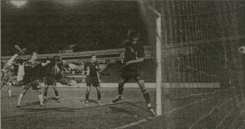
ღინამო — შერანი 24. ვიტალი დარასკელის საფარიშიდან დარტულ ბურის შერანტოლა მეკარე რევა ნაკუბამ თვალდა გაყოლა

ქვების სროლით და ცემა-ტყეპით საქართველოს ჩემპიონატი, აბა, ვის გააკვირვებ. საკვირველი სწორედ ის არის, რომ ამგვარი დაკა-დაკა ჩვეულებრივ ამადა იქცა.