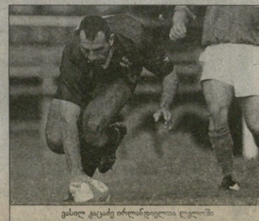
გასლო კაცამე ირლანდიელბა, ლეული

ამდენ დახაცვ გვაქვს. დაბნ, რუსეთი დღეს უფრო ძლიერია, ვიდრე ერთი წლის წინ იყო და ბორჯღალოსნებმაც ოდნავ უკლებს. მაგრამ ჩვენმა ნაკრებმა დუბლინში ორი ლეული გაიტანა და ეს უბრალოდ საქმე არ არის. იმავე დუბლინთან თბილისის წინ ქართველები პირწინად წაგებულბა დაბრუნდეს და ახლა ეს ორი ლეული მით უფრო ბევრს ნიშნავს. რუსეთთან ათი ადენი გაგვეტანოს!