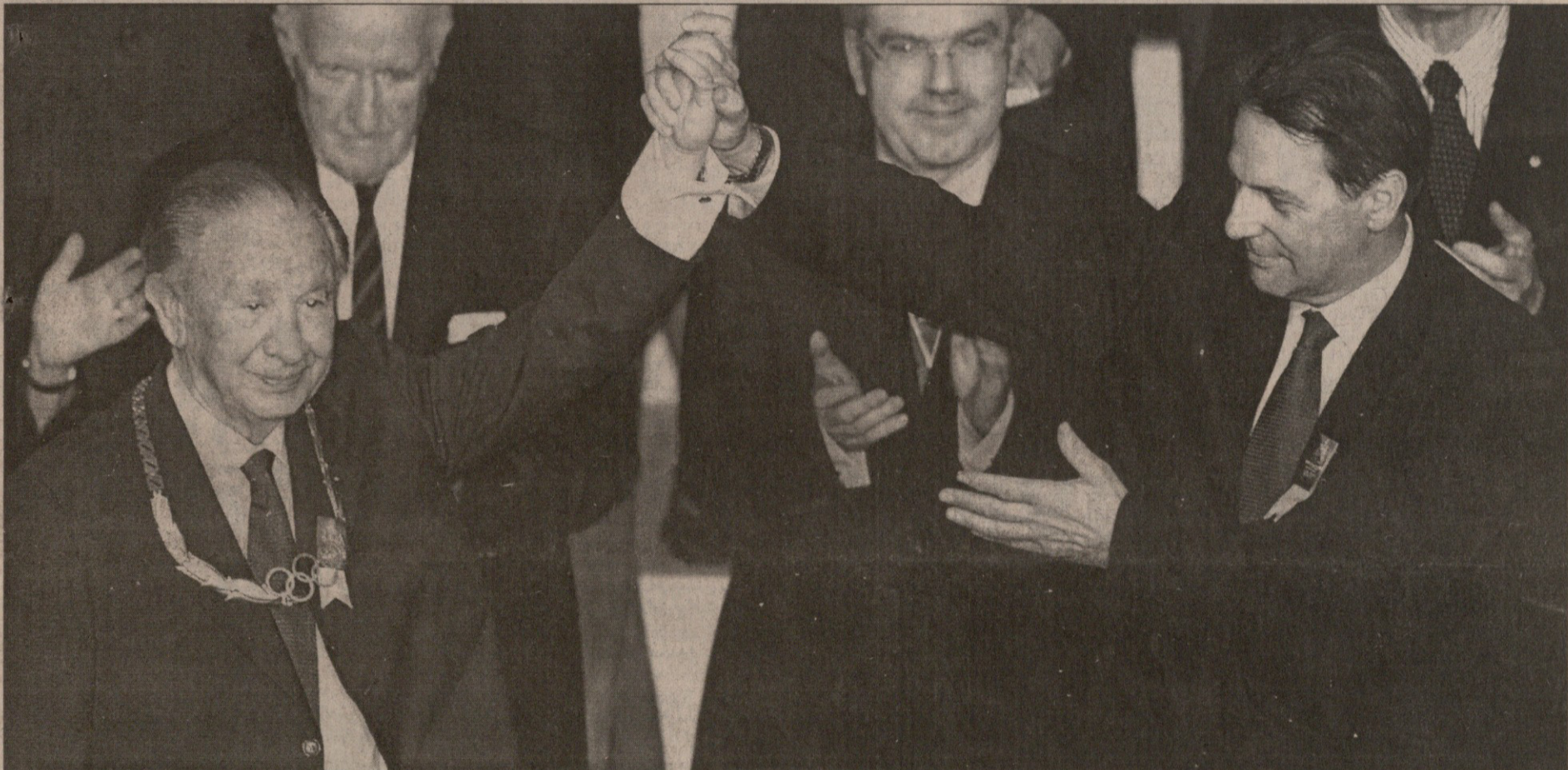
შაკ როგმა სამარანისგან ოლიმპიური კომიტეტის პრეზიდენტად არჩევისთანავე ხუან ანტონიო სამარანი ოლიმპიური ორდენით დააჯილდოვა