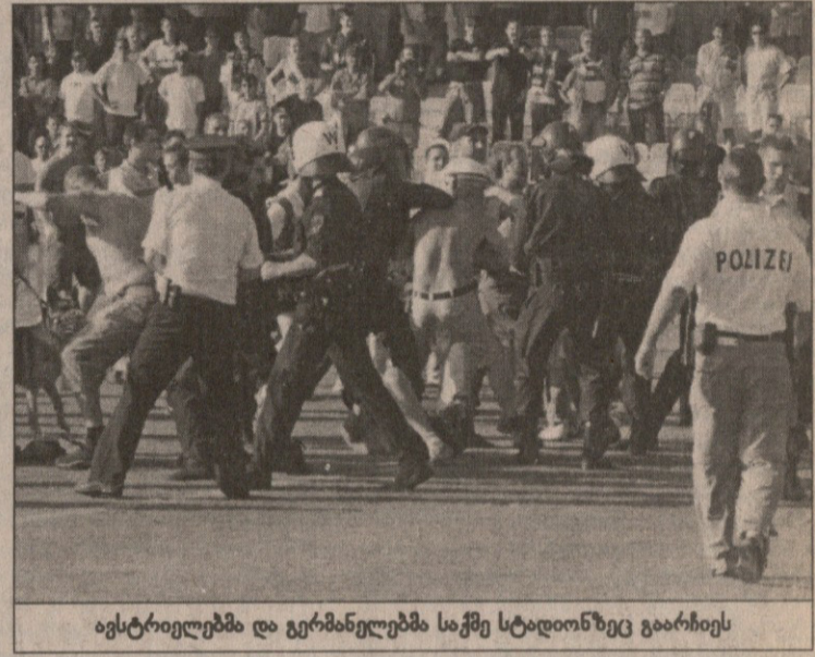
ავსტრიელებმა და გერმანელებმა საჭმე სტადიონზე გააჩიეს