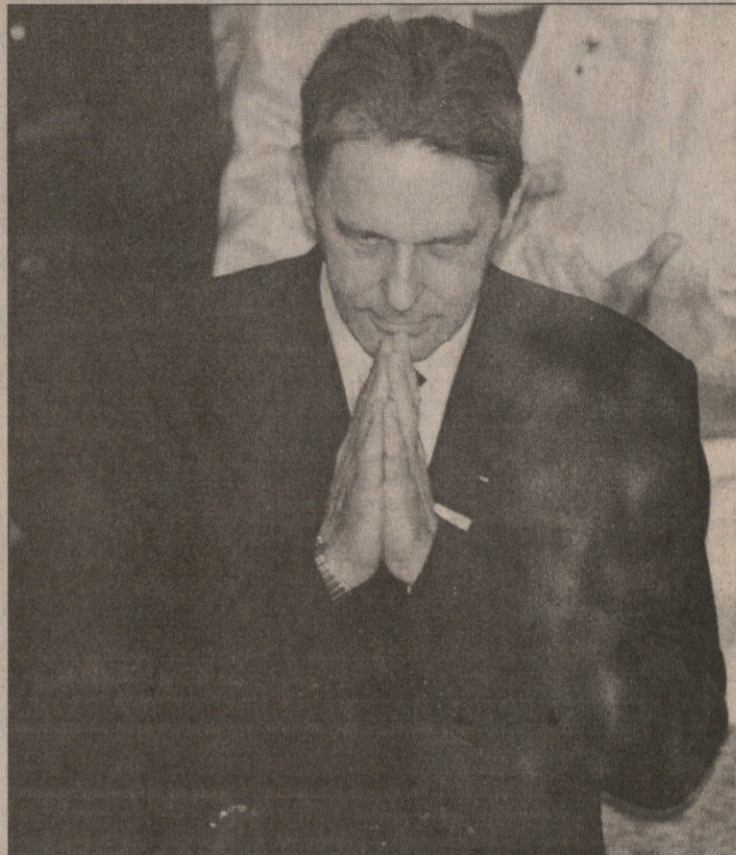
აქ უკვე სოკ-ის პრეზიდენტმა ჟაკ როგმა ღმერთს და ამომრჩევლებს მადლობა შესწირა

— 9.45-10.15: სოკ-ის შვიდი ახალი წევრის არჩევის პროცედურა. ტიმოთი ფოკის (ჩინეთი), რანდპირ სინგპის (ინდოეთი), ჯონ დოული კოტსის (ავსტრალია), ისა პაიატუს (კამერუნი), ადოლფ ოვის (შვეიცარია), ზუან ანტონიო სამარანჩის (უტყროსი, ესპანეთი) და ელრა ვან ბრედა ვიესმანის (პოლანდია) არჩევის შემდეგ სოკ-ის წევრთა რიცხვმა 129-ს მიაღწია. სოკ-ის პრეზიდენტის ვაჟის კანდიდატურას ხმა მისცა 71 კაცმა, წინააღმდეგი იყო 27; — 10.15-10.46 — შესვენება; — 10.47: ეთიკის კომისიის მოხსენების გაცნობა. აღინიშნა, რომ არც ერთ კანდიდატს არ დაურღვევია კომისიის მიერ შემუშავებული ქვეყნის ნორმები, მათ შორის იყო კოლეგიალური და ძმური დამოკიდებულება. და შემდეგ კომისიის თავმჯდომარე გაკვრით შეეხო იმ ფაქტს, რამაც არსებითად გადაწყვიტა ჟაკ როგის ყოველგვარი ბრძოლის გარეშე გამარჯვება. საქმე ეხება კიმ უნიონგის თითქოსდა იმ განცხადებას, რომ მისი არჩევის შემთხვევაში სოკ-ის ყველა წევრი თავის ფუნქციების შესრულებისთვის მიიღებს 50 ათას ამერიკულ დოლარს. ვერ გეტყვით, ეს კორეელისა და მისი გუნდის უნებლიე შეცდომა იყო, თუ მოწინააღმდეგეების მიერ კარგად დაგეგმილი და სწორად გათვლილი პროვოკაცია. ცხადია, ამ ფორმით თანხის გადაცემა არ შეიძლება განხილულიყო როგორც ქრთამის შეთავაზება, მაგრამ სოკ-ის წევრები