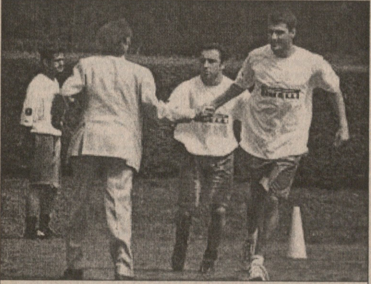
მადრიდელი ვარსკვლავი ვიარი (მარჯვნივ) მისი მომარატისთან დარბაზში

პრისტინან ვიარიმ საუბრებს ბოლო მოუღო. გაირკვა ის, რაც ბოლო დრომდე გაურკვეველი რჩებოდა — რა სურს ფორვარდს და, ბოლოს და ბოლოს, ვისთან უნდა იმუშაოს „ინტერის“ ახალმა მწვრთნელმა ექტორ რაულ კუპერმა. „მე დარჩენა მინდოდა, მაგრამ იყო რაღაც საკითხები, რომლებიც გარკვევას მოითხოვდა“ — თქვა ვარსკვლავმა — „ჩემს გადაწყვეტილებაზე ძალიან დიდი გავლენა, ახლახან, სერ-