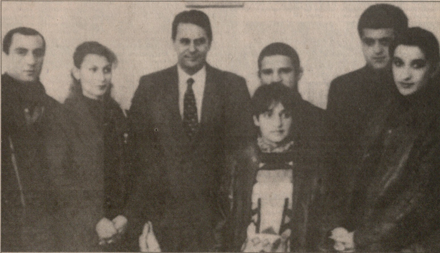
1995 წელი, თბილისი. ჟაკ როგი ქართველ სპორტსმენებთან ერთად

— 11.30: სოკ-ის წევრები და ჟურნალისტთა შეზღუდული რაოდენობა სპეციალური ავტობუსებით მიემართებინ რუსეთის დედაქალაქის ცენტრისკენ — სვეტებიანი დარბაზში. სწორედ აქ 1980 წლის 16 ივლისს აუწყეს მსოფლიოს ზუან ანტონიო სამარანჩის არჩევა. სწორედ აქ, 2001 წლის 16 ივლისს, 12 საათისა და ოთხ წუთზე, ოლიმპიური კომისის შესრულების შემდეგ თავად სამარანჩმა, აშკარად უკვე სოკ-ის ექსპრეზიდენტმა — საერთაშორისო სპორტულ და ოლიმპიურ მოძრაობას წარუდგინა ახალი პრეზიდენტი, 59 წლის ბელგიელი დოქტორი ჟაკ როგი, სპეციალიზირებული ქირურგი-ორთოპედი.