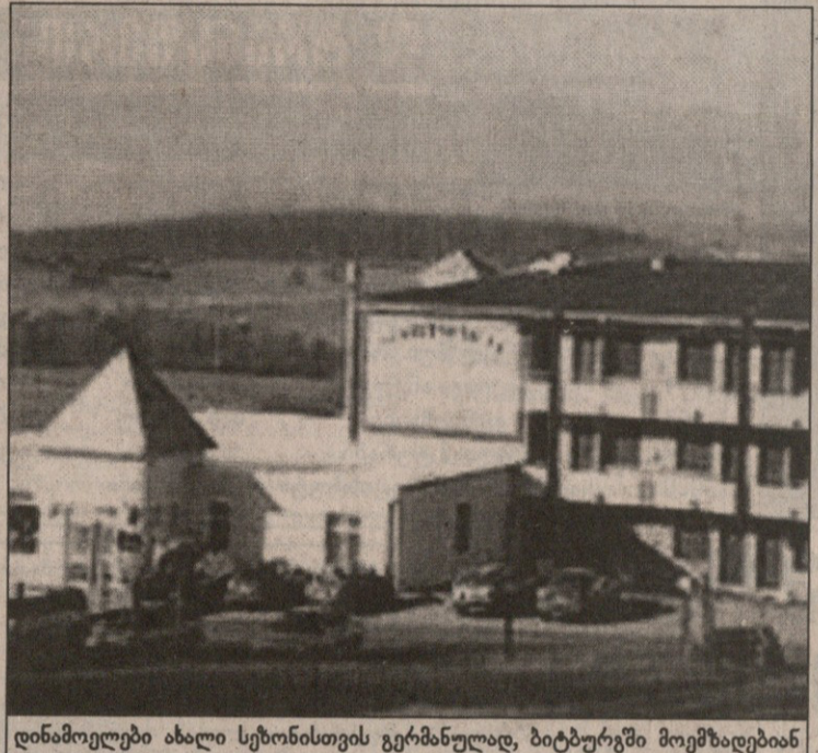
დინამოელები ახალი სეზონისთვის გერმანულად, ბიტბურგში მოემზადებიან

ამათგან „დინამოსთან“ კონტრაქტი ყველას გაფორმებული არა აქვს, მაგრამ შეგიძლიათ ჩათვალოთ, რომ ყველანი დინამოელები არიან — გვითხრა კლუბის ხელმძღვანელობამ. ნოდიას რწეულთა სია ასეთია: