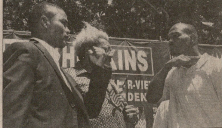
REUTERS ნიუ იორკიდან

ასლოვდება დიდი შერკინება, იწყება დიდი ხმაური. 15 სექტემბერს „მედისონ სკვერ გარდენში“ საშუალო წონის ტიტულთა გამაერთიანებელი ბრძოლაა: წონებში მოგზაური დიდი პუერტორიკოელი, ასოციაციის (ვბა) ჩემპიონი ფელიქს „ტიტო“ ტრინიდადი და საბჭოსა (ვბკ) და ფედერაციის (იბფ) ქამართა მფლობელი, ფილადელფიელი ბერნარდ „დამსჯელ“ ჰოპკინსი სამი ტიტულისთვის იბრძოლებენ. ამათ შუა კი, რა თქმა უნდა, უბერებელი თაღლითი დონ კინგი დგას.