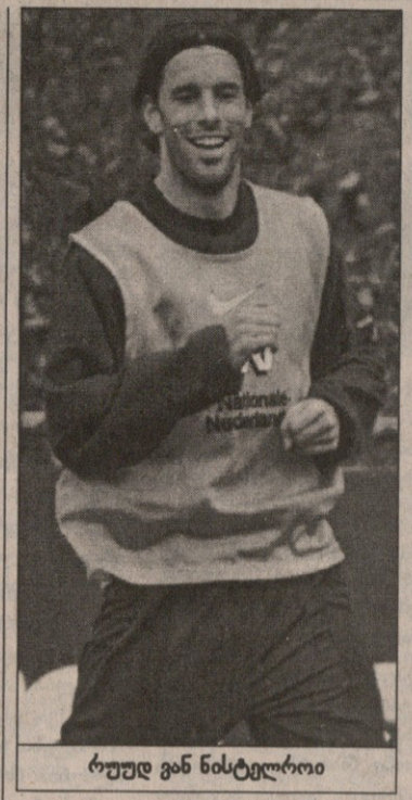
რუელ ვან ნისტელროი