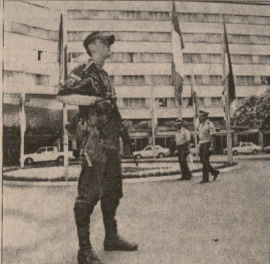
მედელინის სასტუმროს კოლუმბიის პოლიცია და ჯარი იცავს