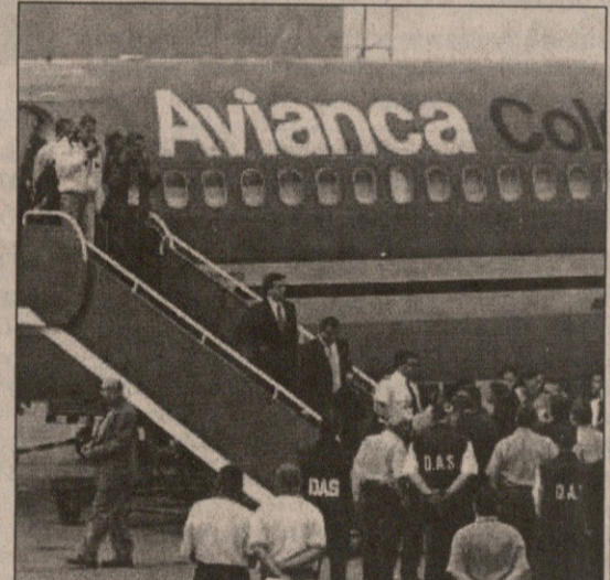
მექსიკის ნაკრები ქალაქ კალიში გუმბინ ჩავიდა