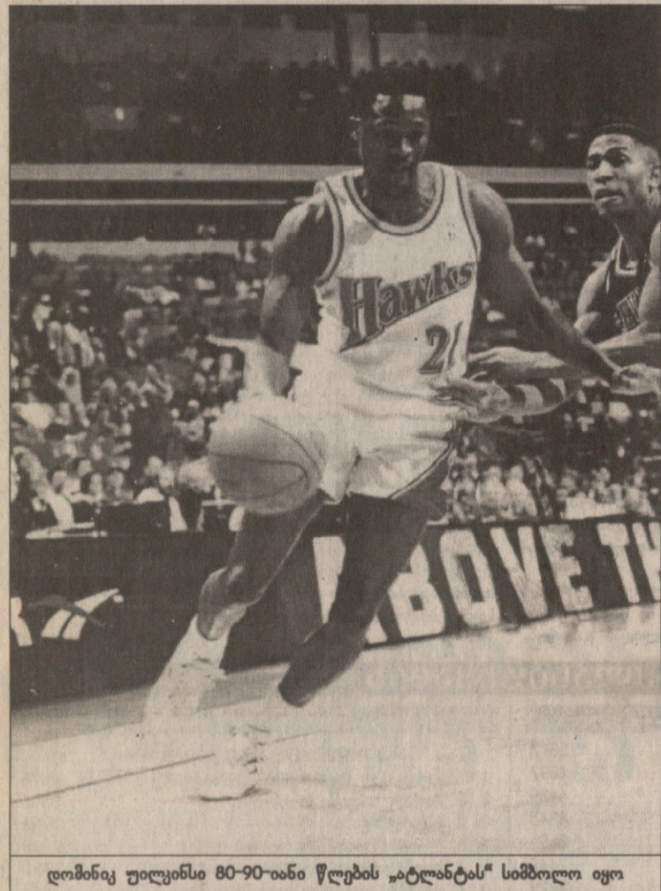
დომინიკ უილკინსი 80-90-იანი წლების „ატლანტას“ სიმბოლო იყო

ჩვენ გვინახავს „ატლანტა ჰოქსი“. თბილისელ გულშემატკივარს ალბათ კიდევ დიდხანს ემახსოვრება 1987 წელს „ჰორნეტს“ სტუმრობა საქართველოში, ამხანაგური მატჩი საბჭოთა კავშირის ნაკრებთან და ცოცხლად ნახი პროფესიონალები — ანტუან კარი, ენტონი „სპაი“ ვეპი, კევინ ვილისი... ეს იყო პროფესიული ლიგის, ნბა-ს ერთ-ერთი გამორჩეული გუნდის და სამოგვარო კალათბურთის გრანდის, საბჭოთა ნაკრების პირველი გაცხიბვრა. პროფესიონალები პირველად დადგნენ მოყვარულთა პირისპირ და ის თამაში მართალია, ერთი ქულით, მაგრამ მაინც მოიგეს. სამწუხაროდ, ჩვენ არ მოგვეცა საშუალება, სპორტის სასახლეში გვეხილა „ჰორნეტის“ ლიდერი და ნბა-ს იმ დროს ერთ-ერთი უძლიერესი მოთამაშე დომინიკ ვილკინსი. იგი თბილისში არ ჩამოსულა, მოგვიანებით შეუერთდა თავისიანებს. „ატლანტამ“ კიდევ ორი შეხვედრა გამართა „წითელ“ ნაკრებთან და სამი თამაშის ჯამში 2:1 გამარჯვებით გაუმეზავრა ოკეანის ვალსა. საბჭოეთთან გაცხიბვრებამ „ატლანტა ჰოქსი“ ისტორიაში შეიყვანა და მართალია, ამ კლუბს ნახევარსაუკუნოვანი ისტორია აქვს, იგი ნამდვილად არაა ის გუნდი, რომელიც ნბა-ს განსვენებისას პირველად დაგიდგება თვალწინ. „ჰორნები“ ამჟამინდელ 43 წლის წინათ მოპოვებული ერთადერთი ჩემპიონობით, თუმც მას შემდეგ ბევრმა წყალმა ჩაიარა და მათი სიამაყის გრძობა წლიდან წლამდე ილევა. დღეს შეიძლება ითქვას, „ჰორნები“ მშვიდობით, უფრო მეტიც, შიმშილისგან დაოსებულები არიან. „ატლანტა ჰოქსი“ ნბა-ს წინამორბედის ბაა-ს დარსების წელს შეიქმნა, თუმც სანამ ნბა (ბაა) თავის ოჯა-