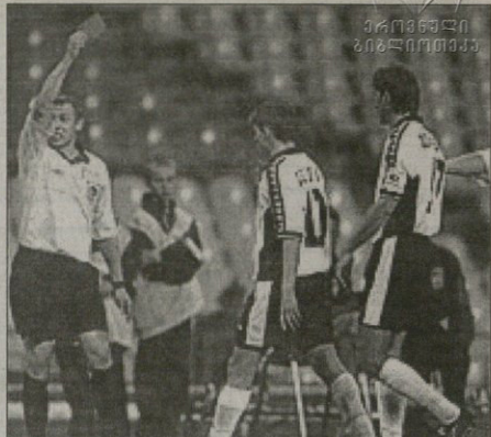
ტორბელი — ზენიტის წინააღმდეგ ბრძოლაში მსოფლიო ჩემპიონის ივანე სემშოვის (შუამდინარე) მსოფლიო ჩემპიონის დისკვალიფიკაციის შემდეგ

მოთხვევით გოლი შეაგდო. შოთა არველიძემ პარტიის გუნდში მარტოველი გოლი გაიტანა. მისი გოლი დაემატა ზურაბ ხუციანთაძის გოლებს. მთლიანად გოლები შეადგინა ხუციანთაძის გოლები. მთლიანად გოლები შეადგინა ხუციანთაძის გოლები. მთლიანად გოლები შეადგინა ხუციანთაძის გოლები.