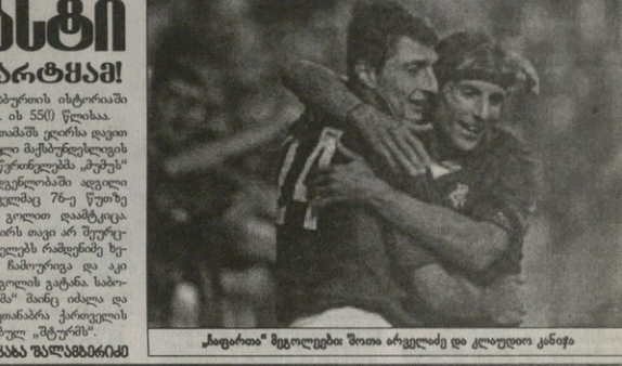
„მინიკო“ მატრიცის შედეგად, მათი ურთიერთობის გაუმჯობესების მიზნით, მათი ურთიერთობის გაუმჯობესების მიზნით...