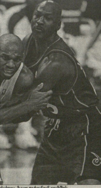
ქერი სტეკასუხი, შესაძლია, მიიღე ქორდინთან თთხამოსი