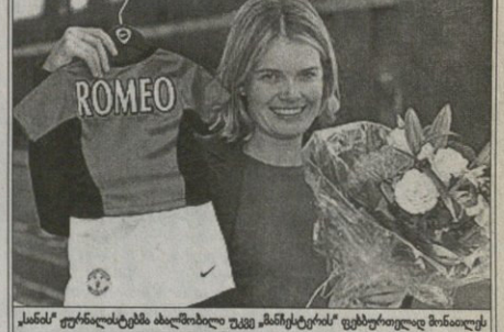
სანამ ფანჯარას დახურავდნენ უკვე „მანჩესტერ“ ფუნქციონერი მონაქვს