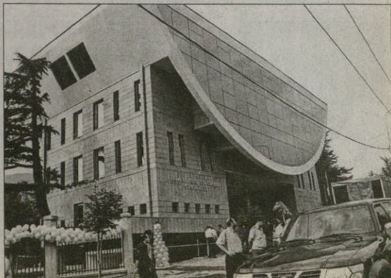
საინფორმაციო სამსახურის მდივანი