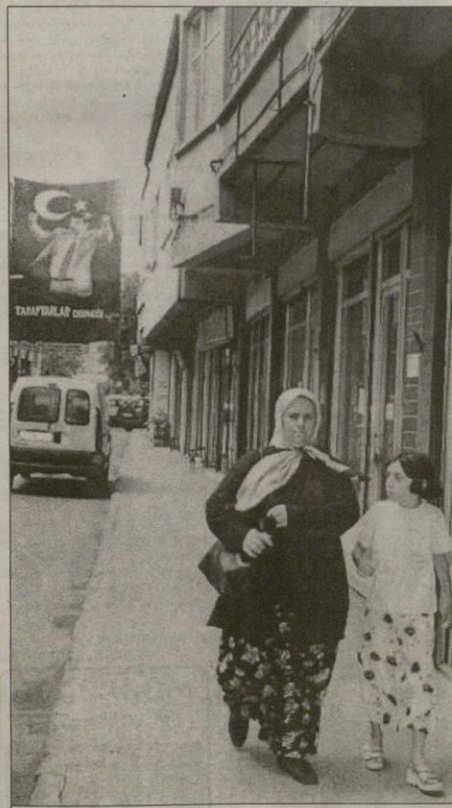
ტრაგიკოსის ქუჩაბანდები შეჩილ ვიქრემისა