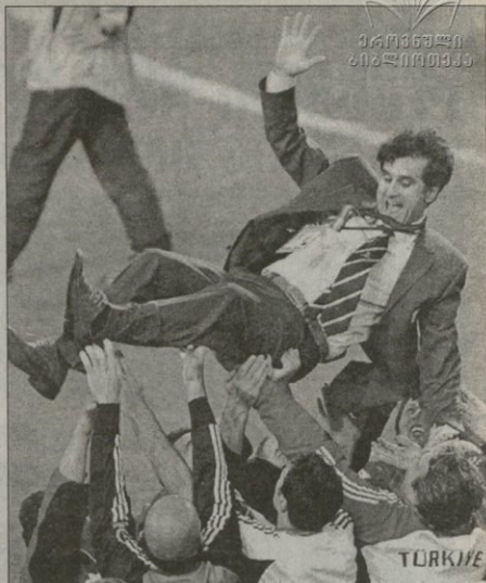
თურქული ტრაგიკოსის ტრაგიკოსილდა შემოქრემიან შეჩილ ვიქრემი და პალე უკუსიო

თურქეთი შემადგენლობასაც ვიქრემი პატარა უკუსიოდა და სათამაშო პლაკატები აკლავა, ილან მანსიზი ახლანას გამოიკვლია, რუმოუ რეკტივი განმარტობისა უჩიოდა ისევე როგორც თუკი და აღფიო. თამაშებზე თუ არა ცხენი აღბაი, შეჩილ ვიქრემი დღეს გადაწყვეტს.