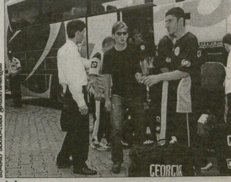
საქართველოს ნაკრები ტრავაზონში მასპინძლებზე ადრე ხივიდა