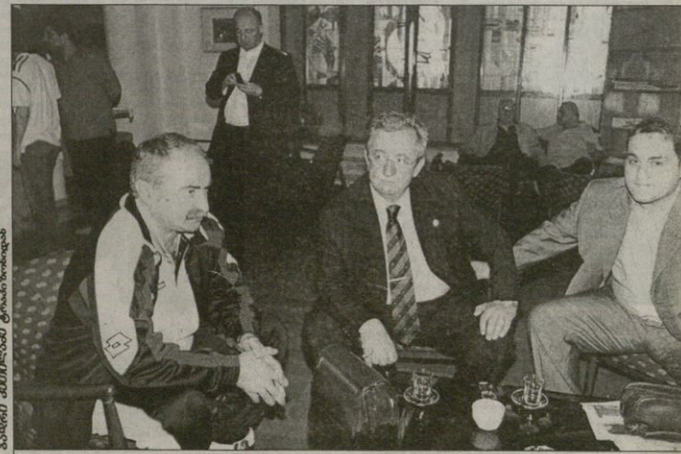
ალექსანდრე ჩიქოვი და ჩვენი ნაკრები არველანდისლონილდა ტრაგიკოსის პრეზიდენტი ჩაქურა პატარა ილანდ მოინახული