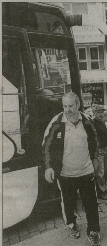
საინფორმაციო სამსახურის მდივანი

თურქები ათი ერთზე აღარ მოდიან. ქართველები თურქეთში იქით მიდიან ქინძლაკას ბალთასხარაი იტოვებს