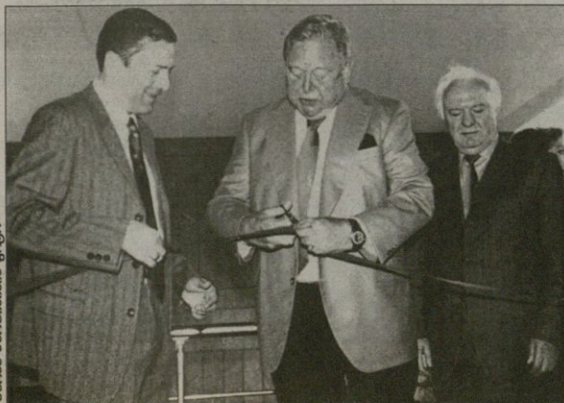
საინფორმაციო სამსახურის მდივანი

უფას პრეზიდენტმა ქართულ უმეგურტს სხლი აუგენა. საქართველოს პრეზიდენტი გახსნას ღამენრო