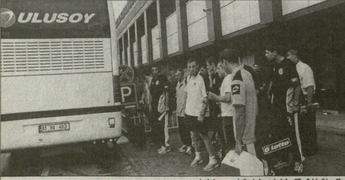
საქართველოს ნაკრები ტრავაზონში მასპინძლებზე ადრე ხივიდა

ტრავაზონი დღეს შეიძლება დაინერგოს ტრავაზონი გუნდის გამგებანს. ტრავაზონი ნამუდგენს უკვე პარალიზებული იქნება რას უფასობენ თურქებს ქართველები? დღევალდით სადამის.