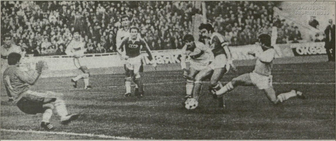
1981 წლის 23 სექტემბერი. სსრკ — თურქეთი 4:1. თურქთა მცარე შერეო გუნდს პირველი გოლი შეთხვევით უწაბრებდა ალქანდრე ჩიკაძემ გაუტანა