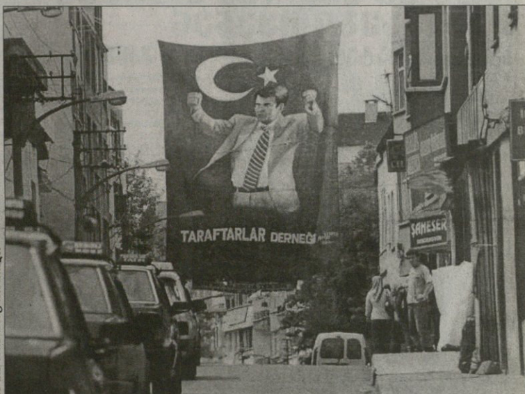
ბრუნდონში ჩასულ აღმასკანდრა ჩივამას ბაღმარეთაული ხანოლ გიანეში შეაგება

გუზინი სხალგაზრდულში ჩვენება თურქებს 1:0 მოუგას გოლი: ასათიანი