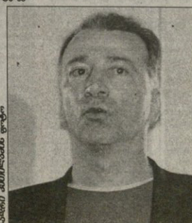
ბლარიანი ამბიოლაშანი ფოტო