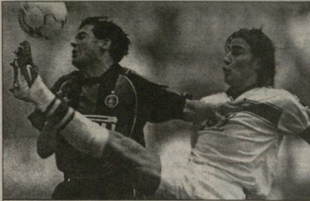
ფაბო კანავაროს იტალია რეკლამისთვის ხურთის არიშვიდ აღარ დასტორღებს