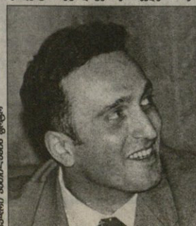
ბლარიანი ამბიოლაშანი ფოტო