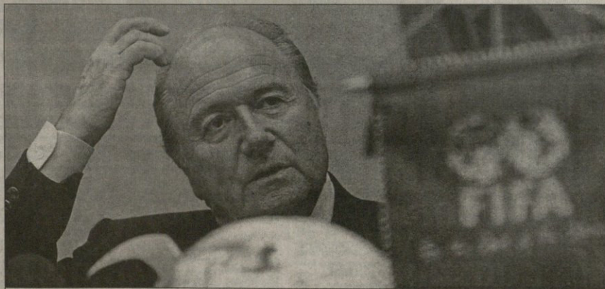
ფიფას პრეზიდენტი იხილვ ბლატერის ქართვლებთან თავი ატკივს

გუშინწინ ჩეხეთის ქალაქ შტრაკონინეში კადეტ კატუთებრეთელთა უკროპის ჩემპიონატის საკვალიფიკაციო ტურნირის პირველივე მატჩში საქართველოს ნაკრები მავრად შერეგვა — სლოვენიელთა 10:3 ქელდას ქართველთბმა კინეღოთა 33-ით უპასუხეს.