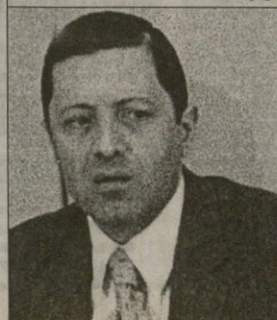
ბლარიანი ამბიოლაშანი ფოტო