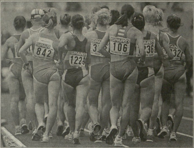
REUTERS მედიის მუშაობის გეგმვა