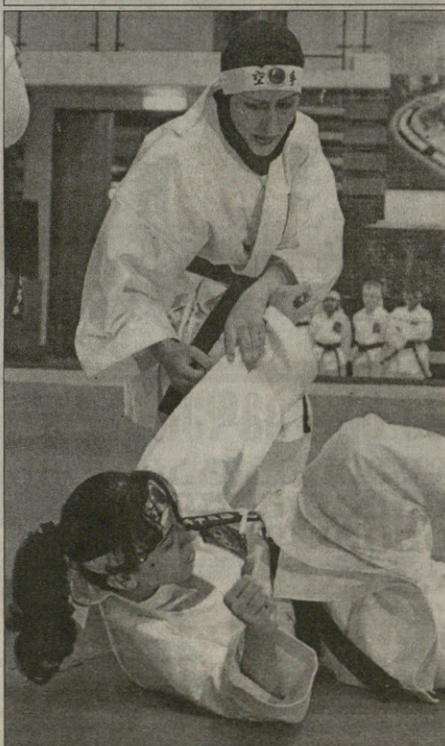
REUTERS მედიის მუშაობის გეგმვა

უბედური შემთხვევის მსხვერპლი შექნა „ლიოს ანჯელის ლიბერის“ გულშემატკივართათვის სრულიად ლეგენდარული კაცი ჩეკერი. პური გამოძევადებულ იყო „ლიბერის“ თამაშებზე 1980 წლიდან, ანუ მას შემდეგ, რაც გუნდი მინაპოლისიდან ლოს ანჯელესში გადმობარდა და გუნდის სიმბოლოდ ათვლებოდა. ათასობით ლოსანჯელესელი სწავლებითა და ყვავილებით მისული პოლიციის დიდების სვეტის იმ ადგილას, სადაც დაღუპულის ვარსკვლავია ჩამოვარდნილი. პური საყვარელ სახლში წაქეზულია და თავის მძიმე ტრავმა მუდია, რის შემდეგაც ხამ დღედა უცხო ხლია.