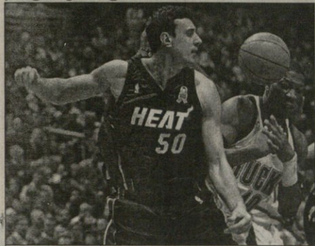
ვლადიმერ სტეფანია ისევ ახალი, ისევ პატ რაილი

ვლადიმერ სტეფანია მამია შიომი რჩება. ადვოკატის ქართველმა ცენტრმა ველ კუიზიან ახალი კონკრეტი გააფორმა. მხარეებს არ მიანიჭეს სტრუქტურების მთავარი პირობების განხილვა, მაგრამ ასევე შენარჩუნა გამოცვლით და გამოაქვეყნა, რომ კონკრეტი ერთნაირი და 1,2-ბითონიანი.