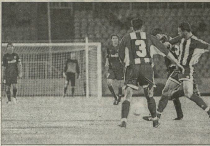
ტრაველი — სპარტა, ტრავისელია მონღოლმა პრადელია ისტრატისა წების შესედა