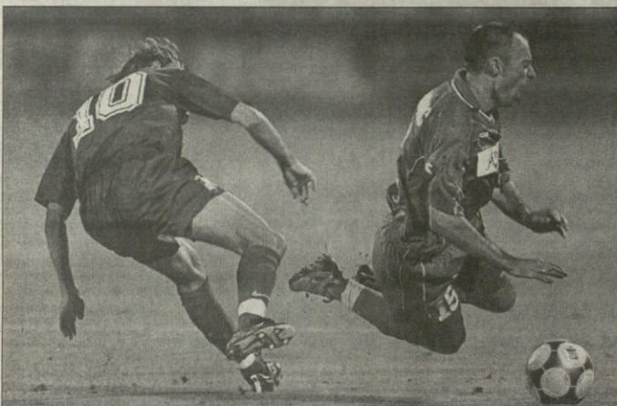
ლესკა — სონტო, ლტვიელმა ვლადიმირის კოლენინიკოვს სპა სპონოვას გოლის გატანისთვის სამეფირო სარწიშა გადაუხადა