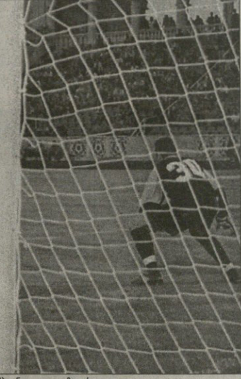
„ტორპედო“ — „სპარტა“ 1:2. ჭუთაისელთათვის ჩემპიონთა ლიგა დამთავრდა