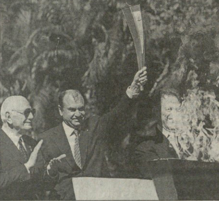
რაი მფ ტანკოზობა