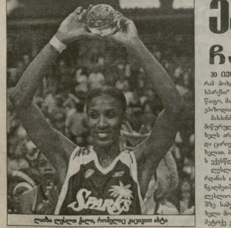
ლიბია ლესლი ქალი, რომელიც კაცებით ბტა