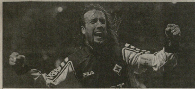
იტალიურ გუნდთან ვეროთასის პირველი მოგება „ფიორენტინა“ სულ რაღაც ორი წლინ წინ ჩემპიონთა ლიგაში ბატისტუტას გოლებით ხარობდა

მეორე მსოფლიო ომის შემდეგ ცნობილი და ფრიად სიმპათიური იტალიური კლუბი „ფიორენტინა“ მეორედ გაეარდა სერია A-დან. ეს გაზაფხულზე მოხდა. მეორე მსოფლიო ომის წინ ვეროპაში საყოველთაო კრიზისი მიქცინვარებდა. დღეს „პეპერ კონტინენტზე“ კვლავ კრიზისია, ოღონდ, ღვთის მადალით, მხოლოდ საფეხბურთო, რომელმაც ზემოხსენებული „ფიორენტინა“, იტალიის 1956 და 1969 წლების ჩემპიონი იმსხვერპლა. კლუბს 22 მილიონი ევრო დაუგროვდა ვალად და ქვეყნის ფეხბურთის ფედერაციის ფედერალურმა