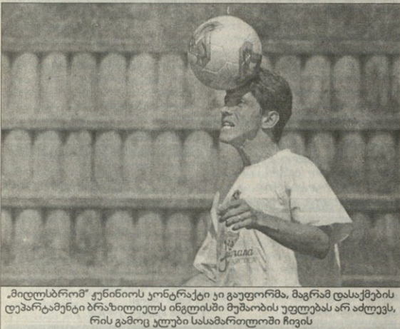
„მილდსბრომ“ კვინიოს კონტრაქტი ყი გაუფორმა, მაგრამ დასაქმების ტენდერებზე ბრავილიტის ინტელისში მუშაობის უფლებას არ აძლევს, რის გამოც კლები სასამართლოში ჩივის