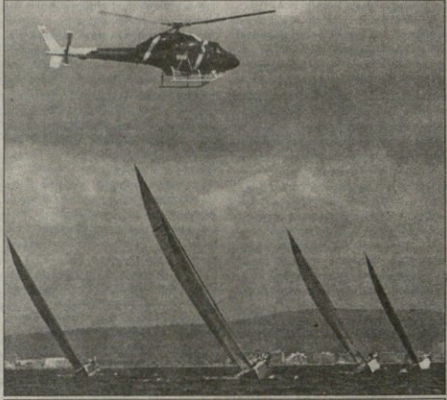
REUTERS პალან მფ

ბელმა დე მალიორეში გახსრებულა და ითხ აგვისტომდე გასტანს აფრისანთა სამეფო თახის გათამაშება, რთმელში გამარჯვებულსაც თავად ესპანეთის მეფე სუან კარლოსი დააჯილდოვებს. შეჯიბრი იტალიკურედ ტარდება, ტელეკამერებით დახსნულელი ვერტმფრენი კი მწიფათად თუ შორდება მიშეჯიბრებს.