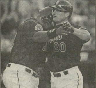
REUTERS ნოე ოიგკაფ