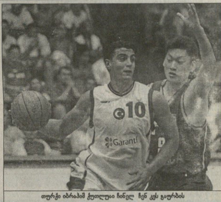
თურქი ბინაში ტელევიზიონი ჩინე ზენ კეს ვაშკი

ფარულია ცალკე ვაშკური ათ მინზე რომელიც ჩინელებს აბრავთ არც დრაფტზე გაუმხილ და არც მის მერე — იაო მინე იმისიდავდა ველავაჟს შემოდან დატურენდა თუმცა ამ უპირატესობას, წრე მართი ბოლოზე ვერ იყენებს. დიდი მათგანდებლობა არ მოუხდინა არ ვიცი, შესაძლოა ბოლომდე არ იხარავებოდა რელიზე მთელი დატურენდა მათგან, იყო ფარულია ჩინელებს უწლიდა და თუ მინასაკველური სერია კალათა მთელსეულად არ ახსილტვა უმეტეს შემთხვევაში იაო მინე ზუსტად აძტებს ის ჩინელებთან 15 ქულით მომადინარ ვახდა და უმეტესობა სწორედ ასე ჩაკვდა. ფარულია ერთი-ორჯერ დაფარეს კარგე, რამაც დაბნაში დიდი ვაშკივდა და ავსტრალია სერევიც გამოვიდა უჩანამზარი სხეულის ვაშკივდა მინე საქაოდ მთელია, ამერკაში მისგან არც კალათბურთის დატურენდა.