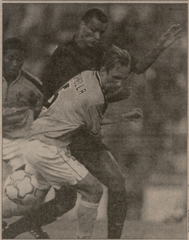
სელტა — ვილენსია. ვიგოელმა ბრაზილიელმა ჯოვანელამ ბარსელონელ ბრაზილიელ რივალდოს ბურთი დაუბოლა