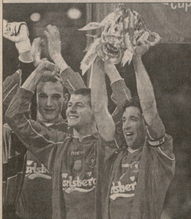
25 თებერვალი, კარლიფი