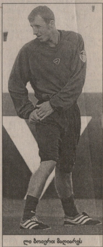
ლი ბოიერა: მილიარდს

წიგნი და თავისიანთაგან წლის საუკეთესო მოთამაშე დაასახელეს. ადენი-შოთ, რომ გამოკითხვაში „ლიდისს“ ქომაგები და ფეხბურთელები მონაწილეობდნენ.