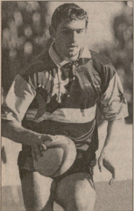
ფრანგული პრესა ქართველი მორაგბის შესახებ