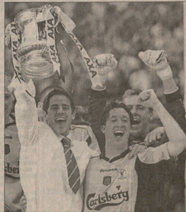
12 მაისი, კარლიფი