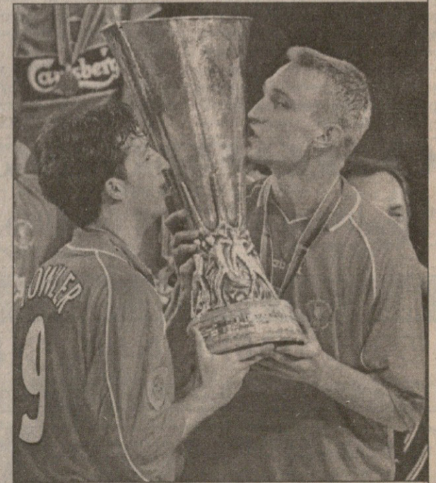
16 მაისი, ღორტმუნდი