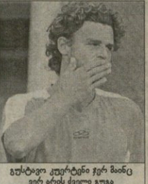
გულტიკო ვერტინი ვერ მინცი ვერ არის ვაგლო გუგო