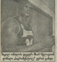
შეიღო ილიოს დეპუტატმა მარკოლიანო ფრანკო კლარსონტეტი ფრანკო