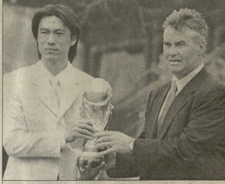
სუნ-პონგ ჰვანგი და გუს პაიდონგი მსოფლიოს თათის სეოლი მწიფრთელს

მთავი მსოფლიო ვიქტო, ვის ვანტოვს პაიდონგი — მწიფრთელის მატჩში ბურჯის, გავალი კავალით მატჩში — ნაკრებს სახალხო გმირი ნამუნგ-სილიანგ ბუნი ჩუნ ჩა ჩამპიონატის და გუს პაიდონგიან სანმონგო მთავარი წარმატებით დატატოვს.