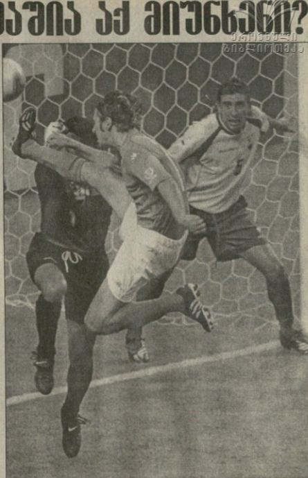
კრისტიანო ლინტი ეგვიპტელებს უპირველად გაასტინა ვერ გაუტანა