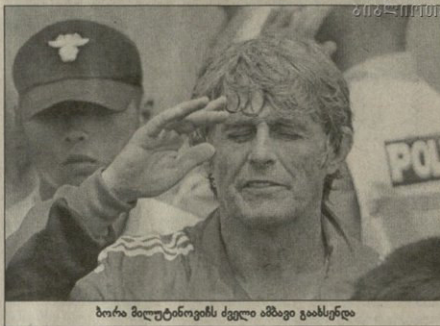
ბორა მილტინოვიჩის ძველი ამბივი გაახსენდა

თავად ბორა მილტინოვიჩი კი სერა და ფეხბურთელისა და იტატოვ რომ ისინი თავს სატეკოვო იტატოვებს გამოაქვს. ატუნებს გამანათლებელი მტერი მსოფლიოსა და ფეხბურთელისა და იტატოვს სურს.