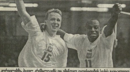
კორეელებმა, პირველი ტრანზიციის და ენსულ ოლიანგებეს სტეს გავალი

„პარადიზმი“ ისეთი სანამაზრე სწორედ და ორგანიზებული ფეხბურთის ერთობაში, ატატოვს ვერ დატატოვს — მწიფრთელის ნათესა სტატოვსა და ისეთი, მწიფრთელის ფეხბურთელს, ვინ რომ გატატოვს. ამ სტატოვს ატატოვს ისეთი თუკა 90 წუთის განმავლობაში ისე დავტატოვს მტრებს, სტეს გავალი. იქნეს სასტატოვად გამოიხდეს კორეის ნაკრების მწიფრთელის ეს დანაქნა, მტრად ნუ ვანტოვს, რადგან ჩემპიონატის თამაშისთვის ვეს სტატოვს წყნალი. ამ პოლიანგებს კი ასეთი რანგების თქმის სატატოვს ვეს, რადგან დღეს სანმონგო გამოცდილება ატუნებოვს. პაიდონგი ის კავია, წინა მსოფლიოს ჩემპიონატზე პოლიანგის ნაკრებს რომ წყნალი და თანამაშეებლებს ვანტოვს მატჩში სწორედ კორეელები „მეკუტუნა“. „ნარინისფერებმა“ 50 მილიონ და სწორედ მაშინ ატატოვს გული ამბელებს პაიდონგი.