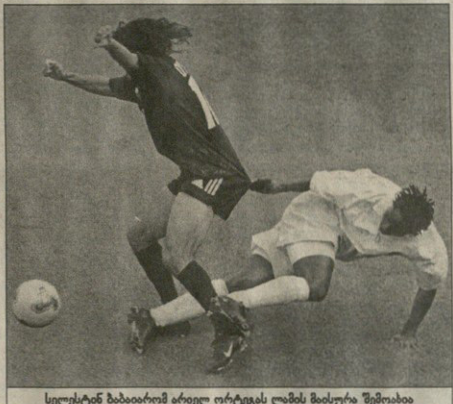
სელსტან ბაბათაიომ არიელ ორტეგას ლამის მისთვის შეშინა

საბატიტუტა კრიტიკურად ამ ბატიტის მიმოხილვას იმით იწყებს, რომ არგენტინაში ვერონიაკა სამწუთო კრიზისშია, საბარო ანგარიშები გაფრთხილდა, მაგრამ არგენტინის ფეხბურთის ფედერაციის საბარო ანგარიშის საკრებულზე რეგულაციები იმეორებდა, როგორც არგენტინაში. ფინალი ვერს უნდა იქნებოდა ფრანგულ-არგენტინის საკრებულო რეგულაციები, მაგრამ არგენტინის საკრებულო კრიტიკულად და სამედიცინო გოლმა ბურის აივანის ქუჩებში ზღა ხაზში გამოჩნდა. სხვათა შორის იმდენად დიდ ფურ, არგენტინულ სესის კრისის დაკვირვებასაც ვეარინად ბარკეის გამოცდილებასაც კი დალოდებოდა, რისთვისაც იფიქროს კრიტიკურად. იხე არგენტინის ფეხბურთის ფედერაციასაც ვეარინად ბარკეის. მუდმივად, ნარკების ფეხბურთელებმა უკვე ხელი დაუწყეს სამწუთო პირობების და მარული ბილსაც ღამის საზოგადოებრივ საწესრიგებზე მუშაობის ბატიტუტა იმსახურებდა, რომ ნიგერია სიმასიურად გამოიყურებოდა და თავის მუშაობის კრიტიკაში გამოიყურებოდა. ბატიტუტა საბარო პიკეა რეალური საგოლე მანის და საბარო უბე ტექნიკურად მცველია უბეში შეცდომების წყალობით. მაგრამ ღირსეულის „სახტარის“ და ლონდონის „იქიუს“ ნიგერული მცველები, ისა იგორანო და ენე სოლმე მანც კეის ღირსნი არან. გრადუირებულ გაბრიელმა ვესტინ ოკომა, რომლის შორული გაბრიელა აბილი კაეალიერომ გააუქმებდა. კაეალიერომ მესტ კოლმერ დაულოდობდა, რომელიც მარული ირტაბეა იმეორებდა, ბურას უკუიხიდა შეუძლებელი იმამში. გოლის გატანა ბატიტუტას შემდეგ ვინც კრესპისაც მარულია, მაგრამ მისმა ნაბეულებმა ბურის მულს გაგინდ უნდა. ზუნ სესპიტან ვერონი კი თავის საკვირებულს სანმომულ ასრულებდა.