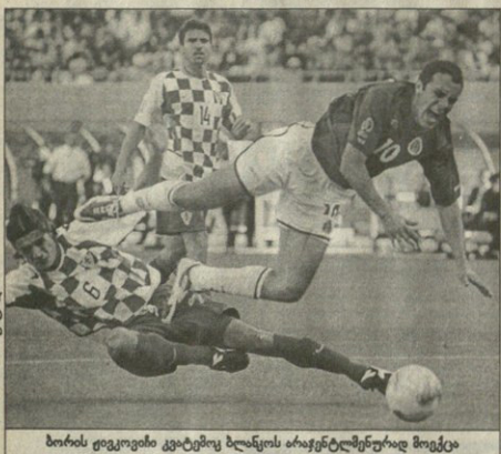
ბორცვები კვავტაბოკას ბერძნულ მიმდინარე მსოფლიო ჩემპიონატზე პირველი ფეხბურთელი გახდა

თამაში დაუბრუნდა მექსიკელს და ის კარგად იმუშავა. მისი პენალტიზაციის გამოცდას დაიწყო. მისი პენალტიზაციის გამოცდას დაიწყო. მისი პენალტიზაციის გამოცდას დაიწყო.