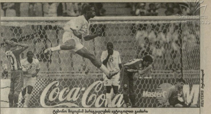
ტაინი მოკონამ პარაგვაელების იტალიელი გიბარა

მათ სონი კი სიუსისო ზუმას იმეზე იყო. ეს ორი ფეხბურთელი სხვებზე მეტად მარტონი თავისი ამბავების გამო. პარაგვაის იტალიელი თავდგომი ძელი სანტოს არ დაღვრება. ერთი კვირ წინ ამ ბეჭერი ასი მიწები მიიღწედა პირველ ტაინში ბლუმბად მათგან. ხოლო, თან რომ-სამ მეტელთან დაეხვედნენ. სიუსისო სანტა კრუსისგან იფეხვდა. დროულად ვერ დახმარების გამო, ფორვარდის გარეა უმეტესად არ ფასებოდა. მის მიერ რამდენჯერმე კარს წინ წაწოტებულ ბურთის პატრონი არ გამოვიდა. აი, ფლანგებიდან ჩაიფიქრებულ ბურთებს კი წყველსათვის თავს თვითონ სანტა კრუსი ურტყამდა. ტაინის მარჯვლენი აფრთხილება კარსკენ სავარაუდო დარინა. ფრანსისკო არსეს პასან მიიღწედა მეტელის თავს ზუსტად მათგან და ჩეხარ მაკკარტი ჩილაკრტს, ორჯერ ერთად კი დანარტყეს გადასაწყვეტი მალე ფორვარდის კიდვე ჰქონდა კარგი მომენტი, თუმცა არჩნდეს არ დადგება. პარაგვაელები მეტობის ბლავე მტერ