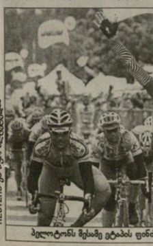
მარბი ჩილინი ფედალს აღვიდა სურავს არ განხილავს — ამბობს მერ ჩილინი