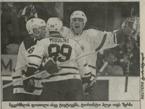
ტოროტოს ფილილი ისე ტოტევიტს, ტოროტოს ბელი თეს შერის

ნაიბილინი მარბი ჩილინი თეი მარბი ჩილინი თეი მარბი ჩილინი... და იტყვალე კიდურის, მარბი ჩილინი ფედალს აღვიდა სურავს არ განხილავს — ამბობს მერ ჩილინი.