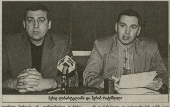
სპორტულ კლასში მოღვაწეობის გაერთიანებაში მონაწილეობის გაერთიანებაში მონაწილეობის გაერთიანებაში...