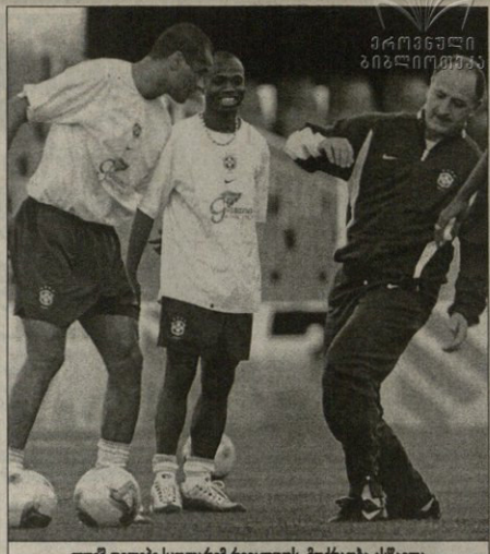
ლუის ფელიპე სკოლარიმ რიველეს მოპოვებია ასევე