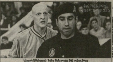
სპორტულ კლასში მოღვაწეობის გაერთიანებაში მონაწილეობის გაერთიანებაში მონაწილეობის გაერთიანებაში...