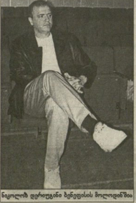
სპორტულ კლასში მოღვაწეობის გაერთიანებაში მონაწილეობის გაერთიანებაში მონაწილეობის გაერთიანებაში...