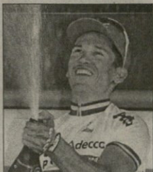
ფაიტრაბასს - მისი ნაიბილინი

2002-ის ბელგიური ფორმირების დღეები ადეცო-სპორტი