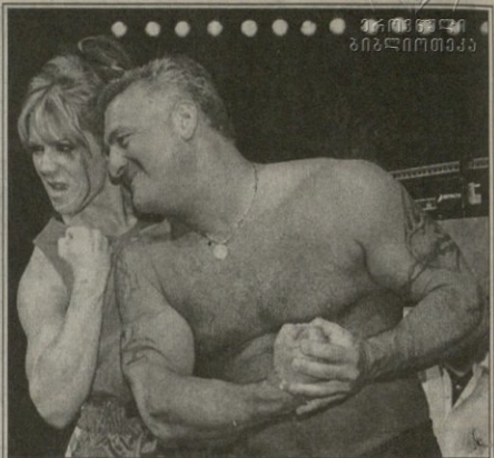
REUTERS ლოს ანჯელესიდან