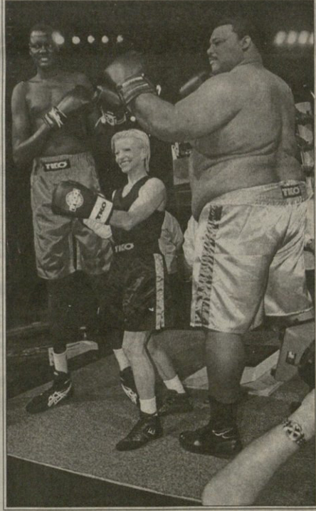
REUTERS ლოს ანჯელესიდან

ლოს ანჯელესში დიდ მოხადე შემოვიდა „ფოქსის“ სტუდიის შოუ, გამორჩენილ ადამიანთა კრივი. გამოჩენილ ადამიანებს კრივის არაფერი გაგვებათ, მაგრამ ტელემაყურებელს კი ართობენ. თავიანთ კუნთებს გვიჩვენებენ იჭერი ცნობილები ჯდ ბუტაფუკი და ჯიან ლორე, მეროე რინგზე კი უფრო მეტ ხალხს მოუყვრია თავი — რუსი ოლიმპიური ჩემპიონი ოლეგ კორნბუტი გოლიათებს შორის ჩამდგარა: ერთ დროს ენბიეის ყველაზე მაღალი მითამაჟე, ტანხველი მინუტე ბოლი და უდიდამ „მაცივარ“ ბერი კარგ ხასიათზე არიან.