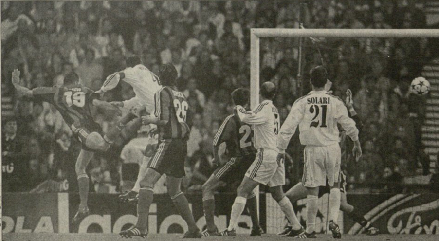
ლევერკუზენელი ლუსისი (№19) გოლმა გერმანელებს შიშლივ სული მოითქმევინა

დარბის, ვისაც „არედიანის“ წინა სეზონში ვაუტანია, ანგარად ვერ ივარა. პირველი ტაბის მიწურულს კი ერთი მომენტზე შეუქნა, რომელზეც უკვე ვიციტი — ზიდანის გოლზე. შეუქნების მერე საწილის ბრწყინვალეობის ვალოც ადარ დარბა, დღეის ფინალი რაული რაული, უსხრე თამაშს დაწმუცავსა თუკი „არედიანს“ რა ბრალია, აქი ანგარიში ჩამორჩენის ბატონის მერე ფრანს ვამარცა რაულს ვერანმეწილი იფრა და ვერ ახერხებდა მისხედა ბალასაც ანგარიში ვერ იფილა „ოქრის ბიპიონის“, შეუძლებელ შეხვით ბურე ულვ კარსტენს კი ბურთი არც მუხლას ვროდორკი, რაულ ბატონობის მუხრეც აქვს, მაგრამ სეხარსის დამაწვეტა იყო და კარში კასილასი ჩაივტა. ბოლი წუთების დრამატუბი კი ნადივ დარბა უქმნად ვაყვინილ მორე ტაბად, რისი შეხრეწილეც — მასი თორე ბურე შექნა. მარდილეთის საგარეო-მონი ჩასულმა მუხრეც თავური რაულიც ხანტიმტრებით ავიდა ბურთი კარს, ხოლო ამ ეპიზოდს სამი სხეცე მოიკვა — კასილასმა დიდებული მთიერება ვერაგულად დარტმინა, მერე მარბილელმა მცდელმა ვამოიტანა ბურთი კარის ხაზიდან, ბოლის კასილასმაც იფიცი ვაიკეთა და — თამაშიც დასრულდა. „ლევერკუზენის“ „პარიზი“ 4 მასიდან თორბეც დღეში სამი ვაილი დაკარგა. რომელიმაც თითი ნათილა ვამორედა — ბრწყინვალეობის წმუთობისა ვერამისის თასი და თამაშიც უკვე დათო რა ხელებივ თამაშის მერე „ლევერკუზენის“ მორეც არ დარბ — იმ ხეცე ვიციტივს მარბილვც ვამოიტანა ვარბილვც რაული სეჭა.