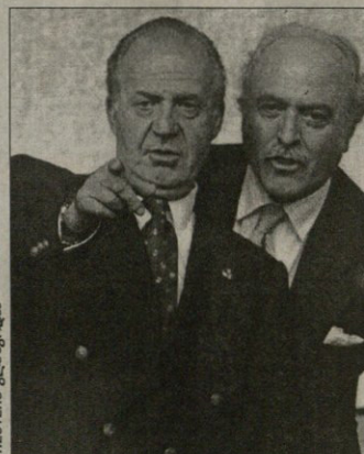
ესპანეთის მეფე ხუანი კარლოსი: იცნობს ჩეჩენებს