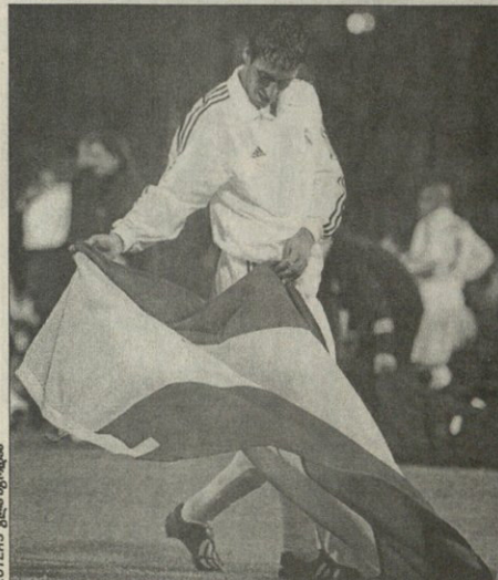
ტიტორია რაული აქემუნდს პარკის“ კორიდაბე

ზინედინ ზინედინი , მსოფლიოსა და ევროპის ჩემპიონს, მსოფლიოსა და ევროპის საუკეთესო ფეხბურთელს, ბელა მანც არ სწყალობდა ასა, როგორცა მანცა, ზინედინ საშერე ვახილევი ევროპის ჩემპიონსა და საშერე ვახილევი — 1996 წელს „პარიზი“ თამაშისას, უფრო თასი „პარიზი“ ათრია, მერე „ლევერკუზენი“ გადავიდა და „ლევერკუზენი“ და „არედიან“ დათმო ჩემპიონთა თასი. მთელად, რაულ ზიდან და რაულ ექვორ რაულ ექვორი ახლა კი გაირკვა, ზიდანის საშუალო იმ კლუბში ვიფილა, 1998 წლის დღეის ფინალში რომ გააჩრდილა მუხრე შხილე, ზიდან