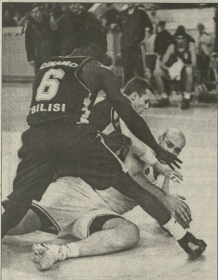
სტრუქტურა კლასში მოღვაწეობის გაერთიანებაში მონაწილე მისების მხეც „დინამოს“ სასპორტული გუნდის მხეც