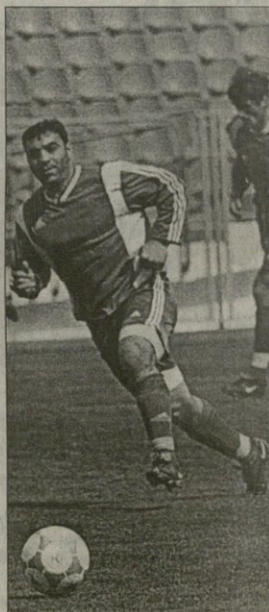
ნარსეულითაში ზაზა ჩანშიშია მინ გატანია გიბსიენია

თან საჭუე საქართველოს ფეხბურთის ევლავციის ოფიციათი შესესა სტრუქტურის მიდის, სადალ უფროსი არეზიდენტად ნადავ ლანდრე იქნაწმინდის აბრევერ, რაფაც მტერი კანდიდატურა არც არის, ხოლო თბილისის ევლავ კუთხიდან საწინა კრებულ სტრუქტურის იქნებ მალე ახალი პატრონი ევლავოს და არა მტერია მადრი პატარკაციევილი და კომანდა ფრანკოშვიდი კი ფეხბურთის „აღბო აბილიის დინამო“ ივლავისმბება.