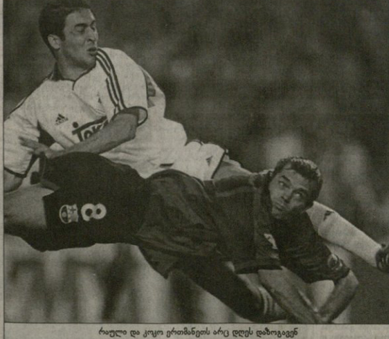
რაული და კაკო ერთმანეთს არც დღეს დაზოგავენ

როგორც გვხვებოთ, თუგინდ მაჯივის დაბარბადეთ, თუგინდ ბედის ბობობლის უცნაურ ტრიოლს, თუგინდ რას, ფაქტი კი ფაქტად რჩება — ორი-სამი ტუროდ და ევროპაში ხეწონი დაიხურება, ხოლო ვითარება