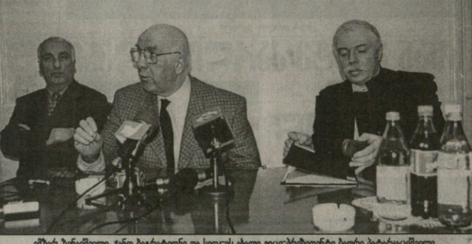
უგულავა, უგულავა, უგულავა და უგულავა

დროც ვერცხვითი უნდა იქნას. უგულავამ განაცხადა, რომ ოლიმპიური კომიტეტის მიზნების მიხედვით უნდა იქნას.