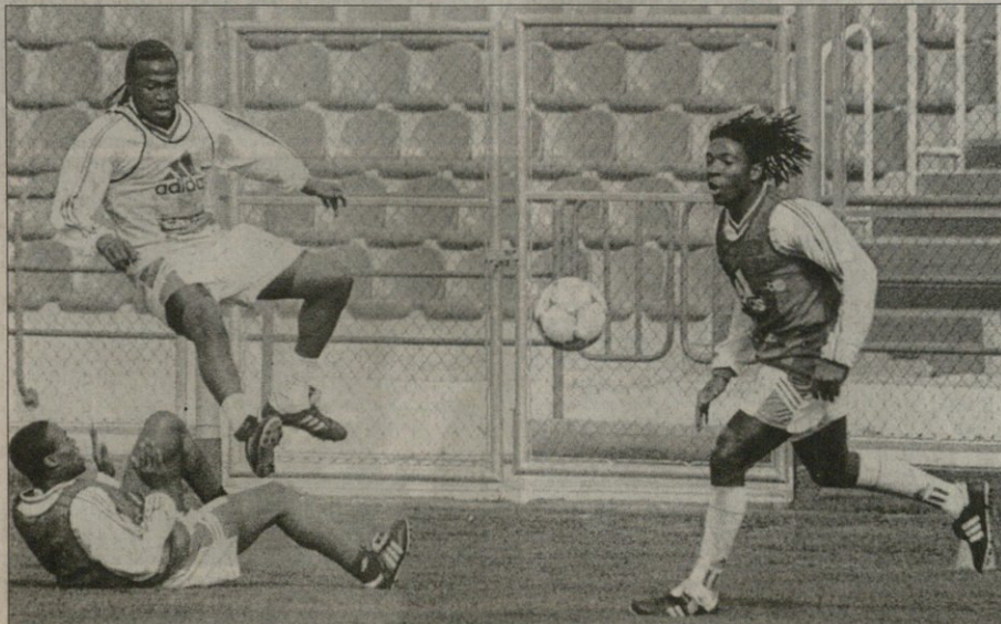
...იფრიალები კი ვაკეში გუმინ ეპიონდნენ, ქართველები რომ სწამ შეეძვევიან