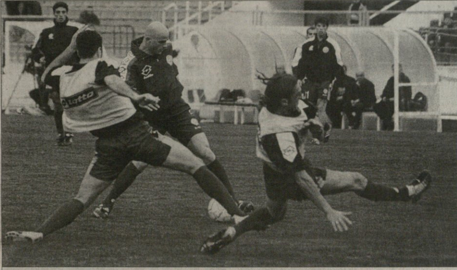
გუმინ ქართველებმა „ლუკომოტივზე“ წასადილევს ივარჯიშეს...