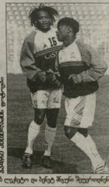
ლეიტენანტი და მუქეჟის მუქეჟი