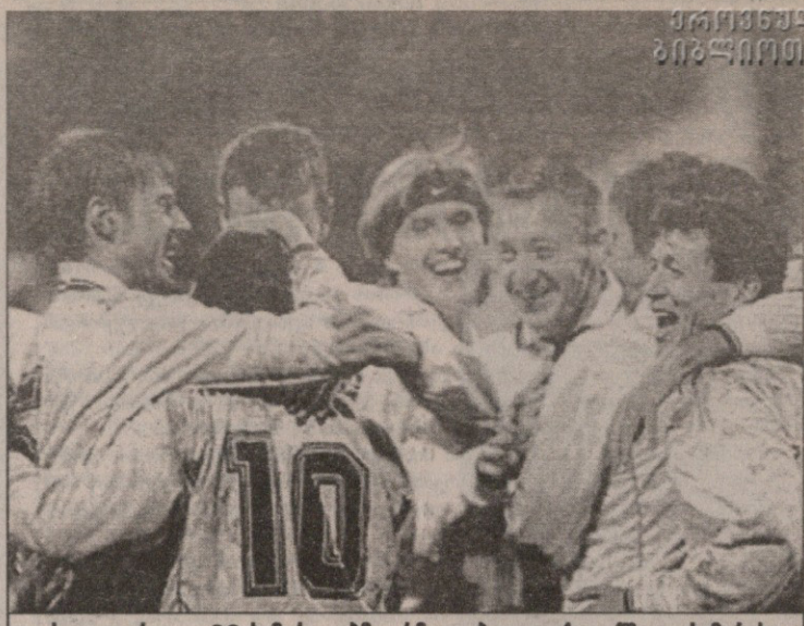
ცსკა — კრილია ი.პ. სამარელებმა არმიელები დედაქალაქში დაასამარეს