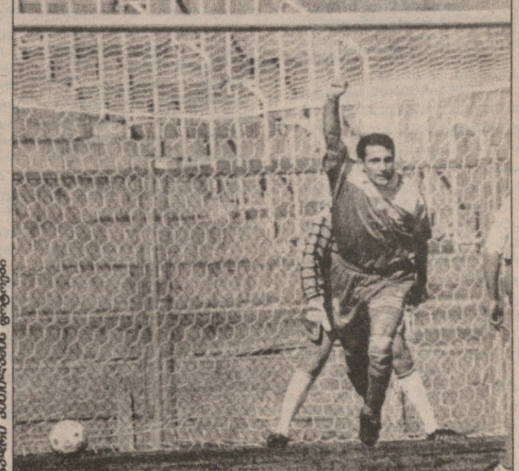
გაიტანა — მცველებს დაასწრო, მარცხენა ფეხით დაარტყა და ანგარიშიც გაასადა