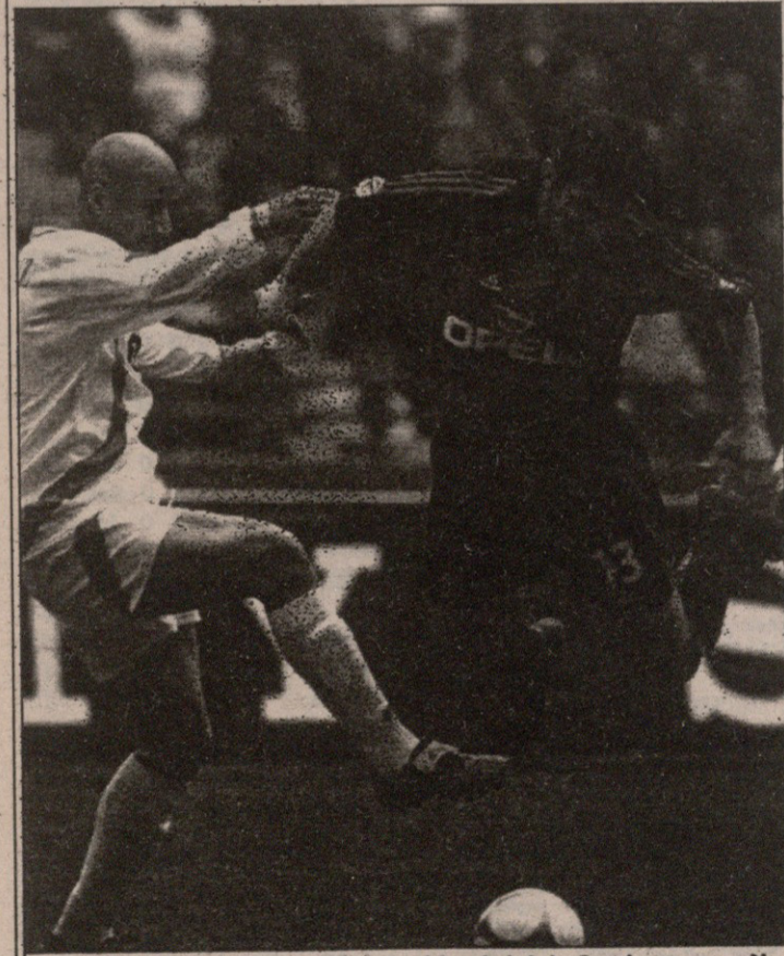
სტუმარი რამდენიმე ნიჭიერობა კაპა კალაძის განხორციელებას ამგვარად ცდილობს

შეგენკო: „ბედნიერი ვარ. ჩემპიონთა ლიგადან გაგარდნის შემდეგ გამარჯვება ძალიან გვეჭირებოდა. ასე კარგად თამაშის შემდეგ უკრინის ნაკრებში მხარგამართული წავალ, ხოლო, რომ დავბრუნდები „ლაციოს“ შევხვდებით.“