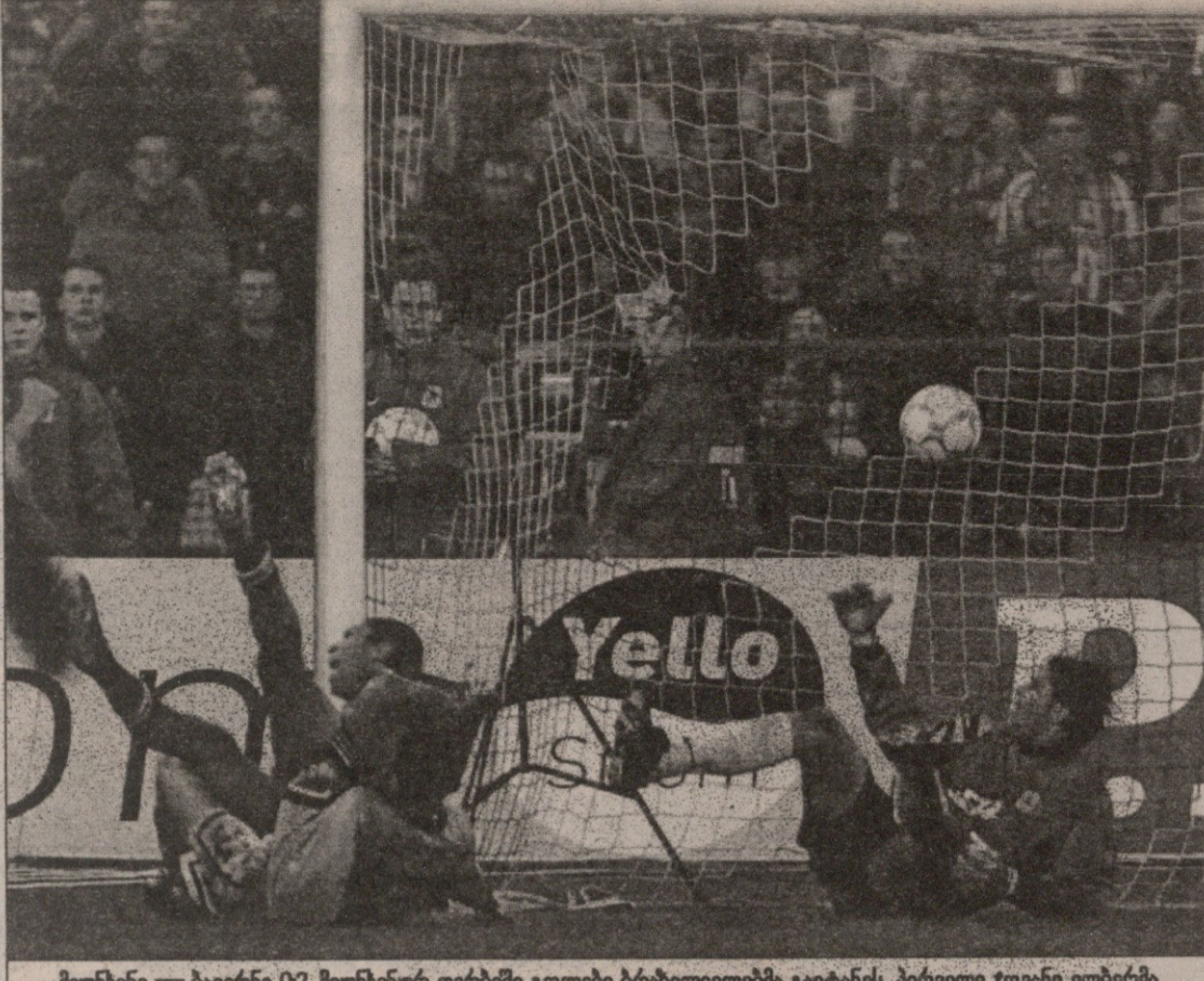
მიუნხენი — ბაიერნი 0:2. მიუნხენურ დერბიში გოლები ბრაზილიელებმა გაიტანეს, პირველი ჯოჯინი ელბერმა

მწვინელი: ვოლფგანგ ვოლფი გაფრთხილება: ბილიკოვი, შიტი, კელი, სელიმი გაფრთხილება: ციკორი (86) 34 214 მაცურებელი