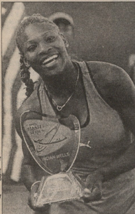
AP ინფოინან უელსიდან