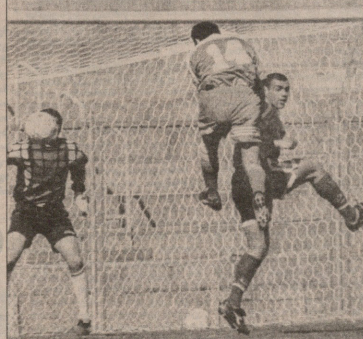
„ლოკომოტივი“ — „დილა“ 5:0: გორელთა განადგურება მიმუქა რუსიამ (№14) დაიწყო და დაასრულა