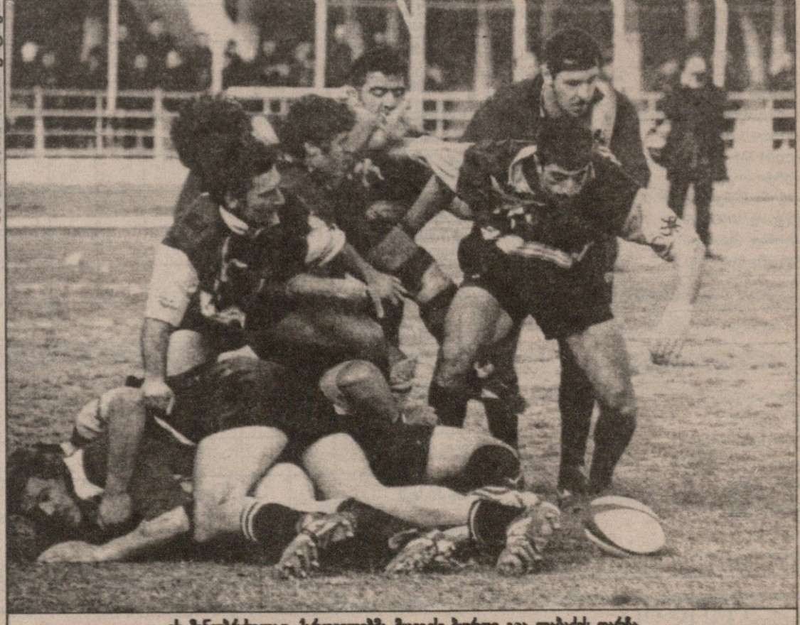
ეს მინიბრბოლიც ქართველებმა მოიგეს ბურთი გაა ლაბაძეს დარბა