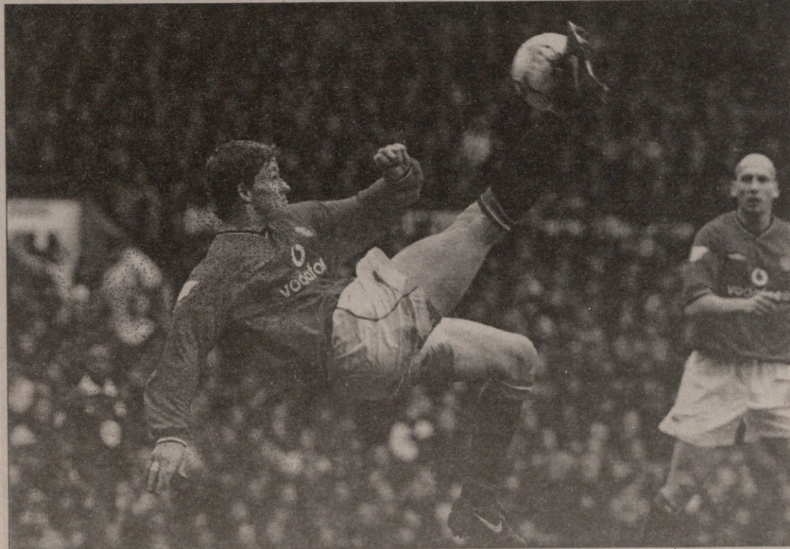
მანჩესტერი — ლესტერი 2:0. ოლე გუნარ სოლსკიერმა მიწაზე ფეხის დაუღმეულად გაიტანა

შემადგენლობაში. თუკი ორგანიზებაზე მსჯელობა „საუთჰემპტონი“ უნდა გასწავლიყო „ქოლდის გუნდმა“ ამჯერად „ევერტონი“ დაამარცხა და კვლავ არ გაუშვა გოლი. ახლა სამხრეთელი მერვე ადგილზე არიან, ბოლო თორმეტი მატჩიდან ათში გოლი არ გაუშვიათ და უფას საგზურს უმიზნებენ, რაც გაუგონარი ამბავია კლუბის ისტორიაში. თუმცა, არავე იცის, შერჩება, თუ არა ჰოლდი „საუთჰემპტონს“ სეზონის ბოლომდე რადგან ამბობენ, რომ სულ მალე ის, პარასკევს გადაყენებული ვორჯ გრემის ადგილს დაიკავებს „ტოტენჰემში“. უმწვერლოდ დარჩენილმა „ტოტენჰემმა“ კი 3-0 მოუგო „ქოვენტონს“. ორი სხვა განწირულის, „ბრედფორდისა“ და „სიტიის“ შეხვედრა 2-2 დამთავრდა. „მიდლსბრომ“ კი ნიუკასლში აღენ ბოკსის სუთ წუთში შესრულებული დუბლით კიდევ ერთხელ დადასტურა, რომ ცხრილის ბოლოში ყოფნის მიუხედავად, წლეულს არ გაკარდება.