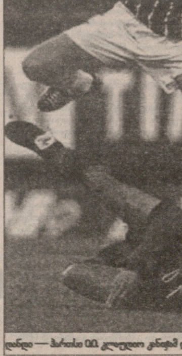
დანი — პარისი ი.პ. კლდელი კინემა და დანდლებმა შოგდანი უკოლოდ დიტოვეს

თავის ისტორიაში რიგით მეთორმეტე ლივის თასი ონილის გუნდმა „პედინ პარკზე“ მოიპოვა. „კლასიკოსს“ 47 წუთი ვაძელო, მერე კი ლარსონმა ათქვა და სეზონის პირალი მო-