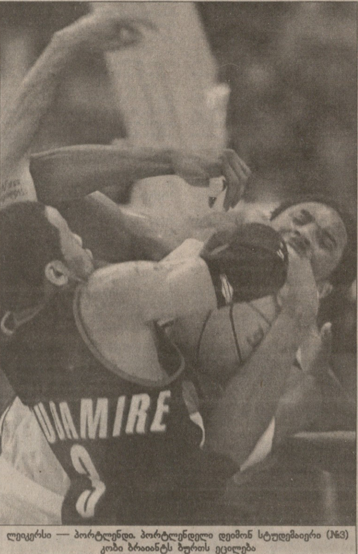
ლეიკერსი — პორტლენდი. პორტლენდელი ლეიკერსი სტუდენტები (163) კობი ბრაიანტს ბურთს ეცილებდა

ფინიქსი: კიდი (30 ქულა, 17 პასი, 9 მოხსნა, 4 ჩაჭრა), მარიონი (20 ქულა, 13