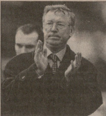
სერ ალექსანდრე ფერგუსონი