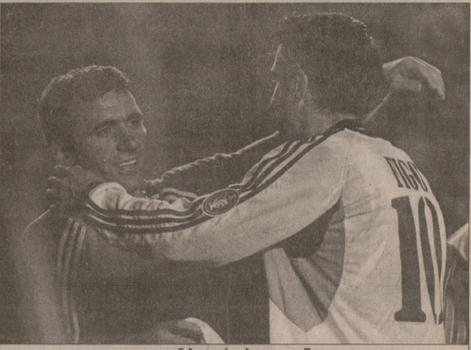
დიდი ითიანება: გეორგი ჰაჯი და ლუიზ ფიგუ