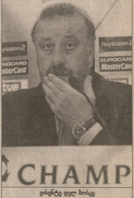
ვისენტე დელ ბოსკე