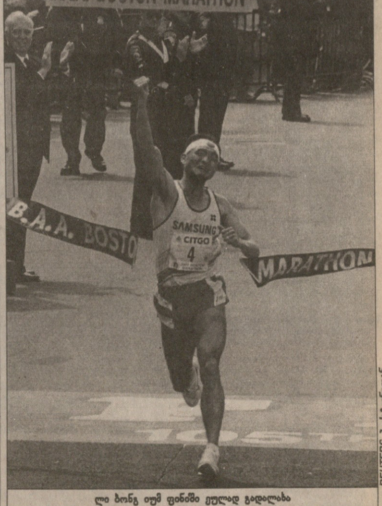
ლი ბონგ იუმ ფინიში ეულად გადაიბა