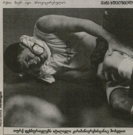
თურქ ფეხბურთელებს იტალიელი კარანბინერებთანაც მოხვდით

„ვატყუა დიდი სავლეთი“ სადას-პროის ამტყუარება, ატყუა, წიხი თუ რათა მერე იყო პროცესებზედაც.