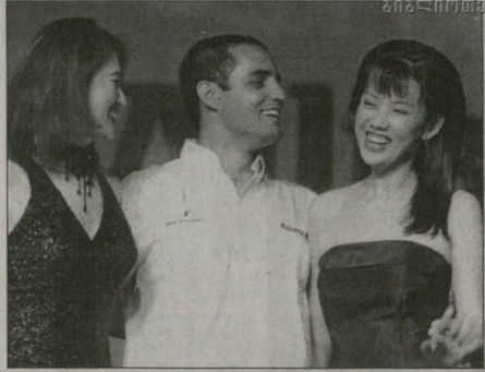
კოალი ლუმპურში

მალაიზიის დიდი პრიზისთვის მზადყოფნა შეგროვრულეებს სულ ნაირნაირ ესკორტ-მზეთუნახავეებს ახვედრებენ კუალა ლუმპურში. ავსტრალიის დიდი პრიზისას თავამოჩენილ უდიდამსელ ნუნან ბაბლო მონტოიას ვეროშულად მოხილი ფოტოები შეეკებებიან, ფერარულ რუბენს ბარაქელისა და მიხეულ შუმბერს კი ეროვნულად გამაჩვიბილი ბანოვანები ამოსდგომან მზარში.