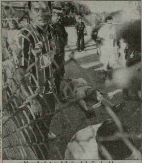
დაჭრილი ჯავარი ტომავთის, მონი, აივის სელია