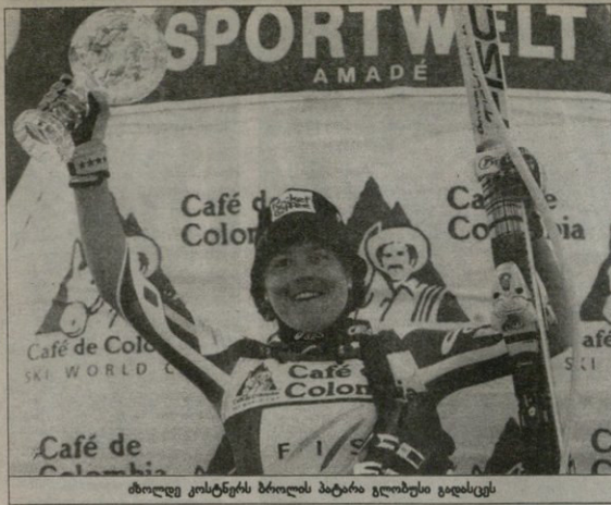
მოხლე კოსტენტის ბროლის პატრია გლობუსი გადისცეს