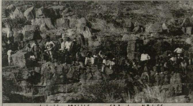
ფიფის თვის გათვლით სანეგალი ფანებს მალევე უფიქრებენ

არის — დაკარის რაიონის აფრიკული მონაწილე ერთი დიდი ვიდეო-ხეობა, სასარის უდაბნოში მძიმე მანქანებს და მოტოებს ცხელ ქვიშა უცხებს „თვალვანს“ თუ „აფრიკის“, უფრო ცხელი მზე აუტანდა იტონება, ტენის ნახსნს არსად ტოვებს და უკან ვაბ, ხალხში მდინარე-ფართი და წყალუბო-ტანჯავ იფინ მათგანებს.