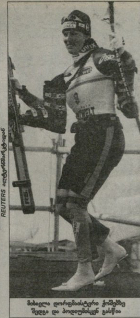
მისელი ღორმეისტერი კომპეტენცია შედეგ და პოლემიკურ განცხადება