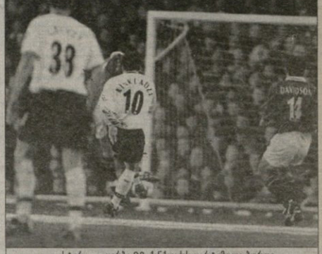
ლესტიკი — დგები 0:3. ქანკლამის დარტყმული ბურთი მცველს მუხეცა და კახის იღობინდა