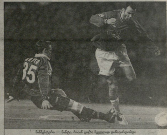
მანესტერი — ნანტი, რიან ვეგეი ზეველად დინეფირობელა