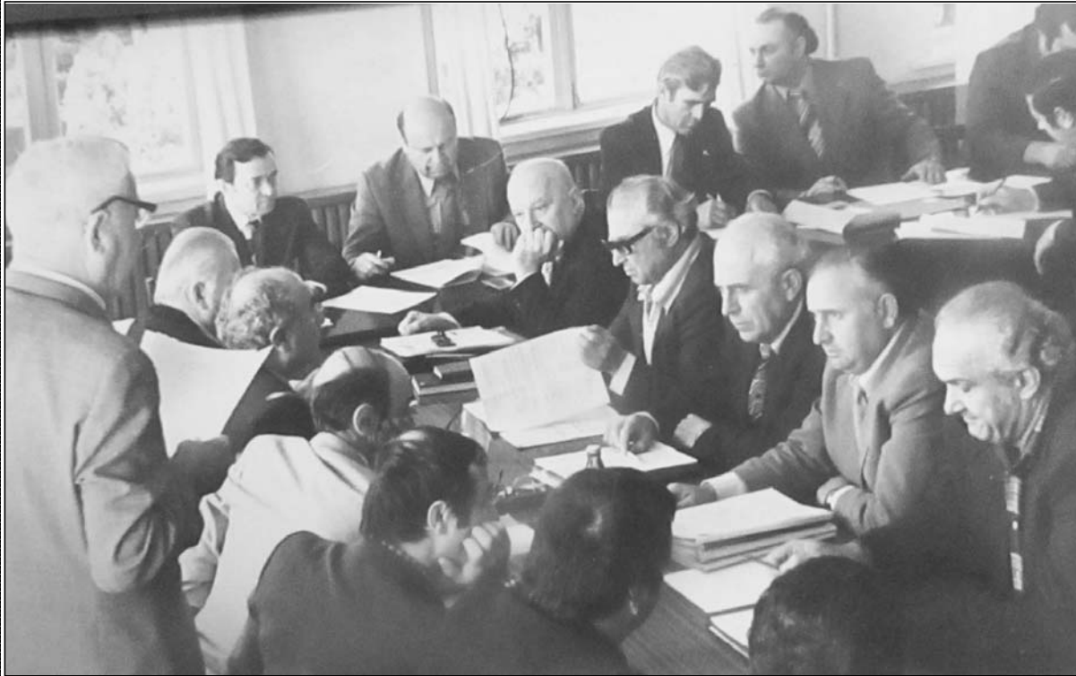
ჩაის მრეწველობის საკავშირო სამეცნიერო საწარმოო გაერთიანების სამეცნიერო საბჭოს სხდომა