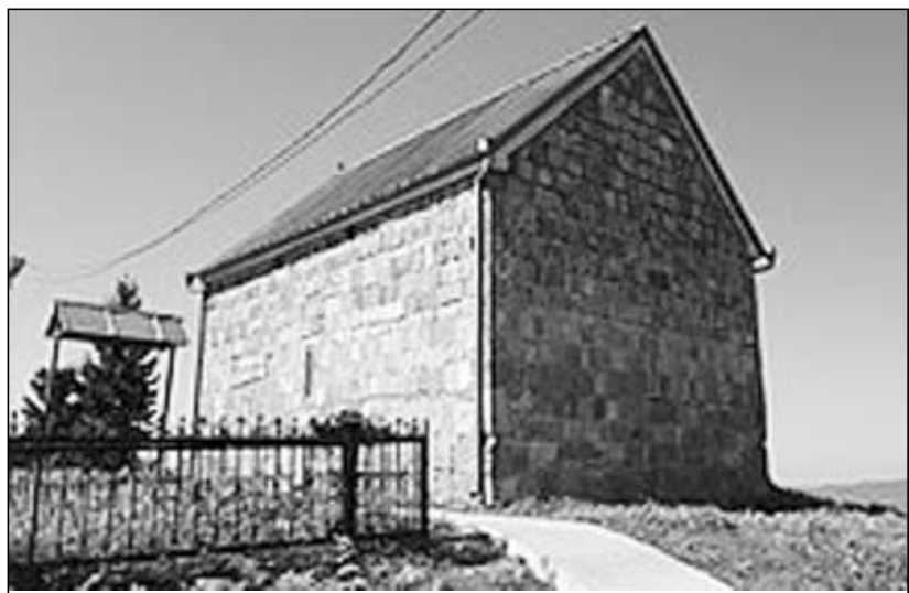
ვანისქედის დარბაზული ეკლესია XI-XIIIსს. (განახლებული)