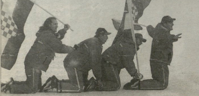
სოლტ ლეკუ სტეტიდან