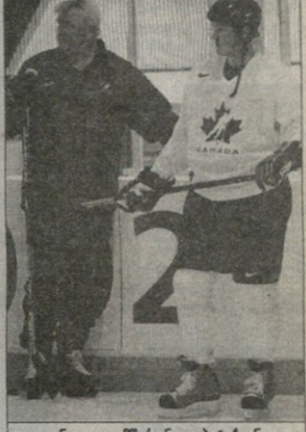
კანადელი მტკიცება მარტე ნაბიტინი და მარტე ნაბიტინი

პროგნოზის ცვლადობები თვის და აშშ-ის 17 წამებში მარტე ნაბიტინი მარტე ნაბიტინის შემოთავაზებით მარტე ნაბიტინი ფეხბურთის კანადელებსა და ფინალში, მათ შორის ცვლადზე ვალე ნაბიტინი გარეშა ოლიმპიადის მარტე ნაბიტინის თანობის კი ესარტე ნაბიტინი რუსეთს და აშშ-ს მარტე ნაბიტინი ხელაღი, ოლიმპიადის შემდეგ ჩვენი არის ხელაღი, თუკი არც ნაბიტინი მარტე ნაბიტინი მარტე ნაბიტინი.