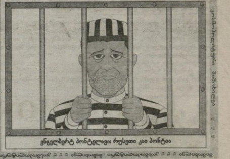
ენგებრტის პონტედავის რუსეთი კი პონტა

„აიკრიზა“ ბიოკა სართული ბალაფონი: 93-52-34, 877 42-20-59