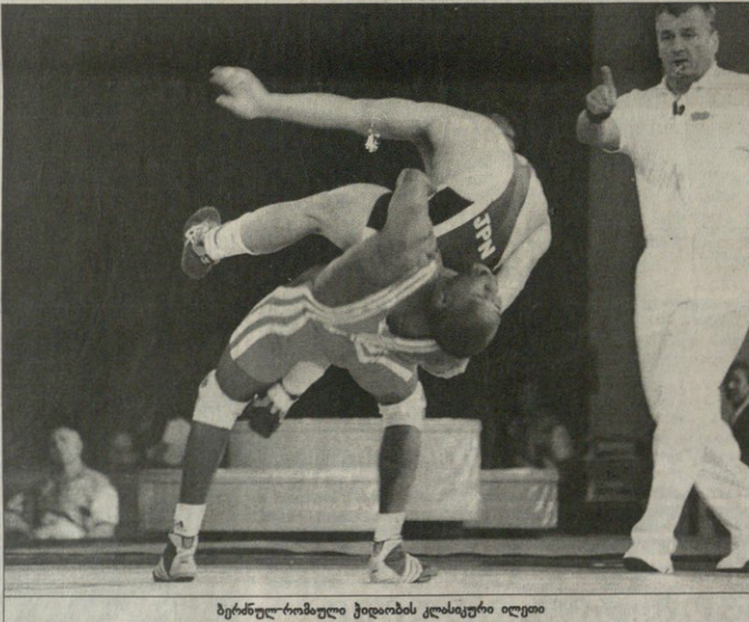
ბერნულ-რომაული ჭიდაობის კლასიკური ილუზია