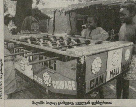
მალში საღაც ვახსკორინთე ვეგულან ვეგულან