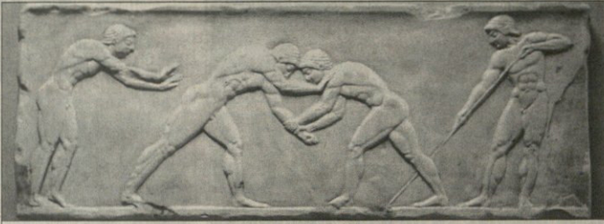
ჭიდაობა. ძველბერძნული ბარელიეფი

ჭიდაობის სპორტის ისტორია ფეხდაფეხად (ფილა) ერთ-ერთი უძველესი და უცვლელი სპორტის სახეობაა. მისი წარმოშობის საკითხი დღემდე უცნობია. მისი წარმოშობის საკითხი დღემდე უცნობია. მისი წარმოშობის საკითხი დღემდე უცნობია.