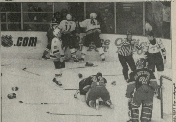
ბენეფიციარი — ბენეფიციარი. დიდი თამაშის სიტუაცია ნიუ იორკში