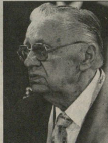
ფილის პრეზიდენტი მლან რეცეცინი