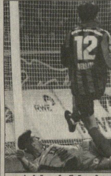
ლევრეტინი — მუნენი. დინიტარი ბერბატოესი საგოლდე ორერე მოქინია

„ვლერტინი“ თამსისა ბუნეკრამონელებს სტორია ჩვენ კი მას დიდი მობითადი შეტყვევ და ვინჩე დამსაზრუნებლად გაემარჯვებო.