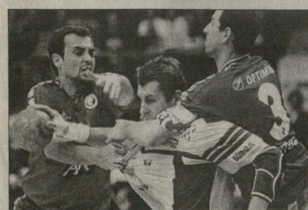
საუბრის სიტყვანი ხელბურთის, შვედ მანუს ვისლანდის (ბურთით) დანი ითხოვს ვიდეო მეტოქისთვის გადავარდნილი პრიზობა

ახალი გერმანიის ნახევარფინალურ ეტაპში, რომელიც გადგინდა, რომ დანი უაღრესად ახალგაზრდა სპორტისტების შევსების გამო მსოფლიო ჩემპიონატის დასრულების შემდეგ, რაბინი დასრულებული გახდება.