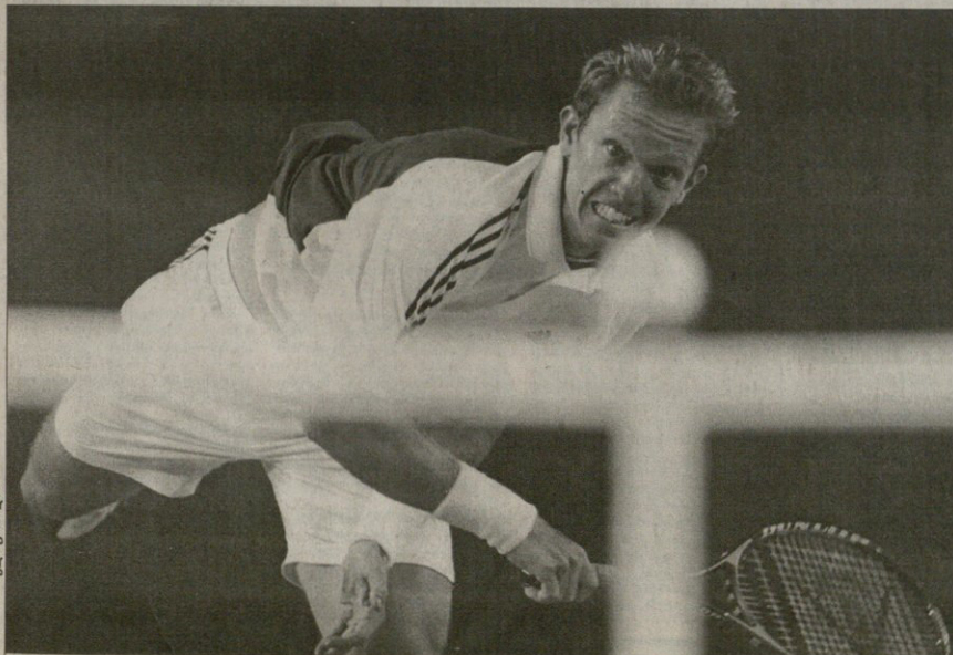
შეეღმა ტომის იოპანსონმა ნახევარფინალში ღიდი გაბორეხები გააღწია

ისინი კვლავ ერთმანეთს წევეარენ, ისევე, როგორც შარშან ამ ღრის და ისევე ფინალში. ავსტრალიის ღია პირველობის ქალითა ფინალის მონაწილეები არ შეეცლილან, შაბათის კორტის მხარეებს მარტანა პინეისი და ვეენფერ კაბრატი ვაკელიან. ირთეგმ ბოლომდე თითქმის სწორი გზით იარა, ირთე ცალი ხელით უსწორდებოდა მეთოქეხს და მხოლოდ გუმინ, რთია ნახევარფინალამდე მივიდნენ, საშე გვარინად დეუმშიმდე. პინეისი მონაკა სელუის ბარიერს გადაიტყა, კაბრატიც მასზე ტანშიმე და კუნთებიანი კომ კლასტერისი შემოემარცხა, კაბრატიმეე მოუგო პინეისს ამ ტურნირის წინა ფინალი, ანუ შეეცარიელა რეკანშისთვის იბრძოლებს. ვაბოთავან ვერ მხოლოდ ერთი ფინალისტი ვაინევა. ვეკინეი გულშემატკიერების მხარდაჭერით ალტყინეკულამ ტომის იოპანსონმა პირველი მძიმე სეტი მოუგო ჩხხ ირთე სოფაკს, მეორეში ვანადგურდა, მესამე — ზომიერად წავიგო და ბოლო ირთი სეტი მისე სითავისოდ დაიბარუნა, შოი შორის — მეხოე და ვადამწვეტეცე. შეედი ახლა რუსეთ — გერმანიის თმის შედეგს ვლისი მეორე ნახევარფინალში მარატ საუინი და ტომი შაპის ითამაშებენ.