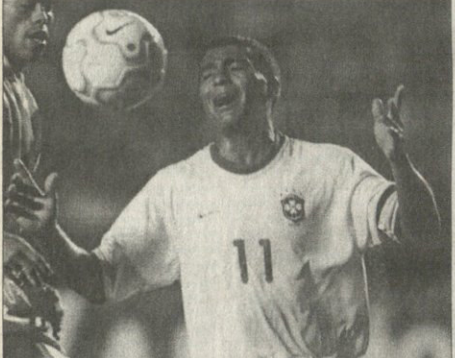
რომარის ბურის უმალღეე

ტელის უოქმის, თუ კორეა-იაპონიის მამა ღაქრი, ზუცებს ეკლებ ზამთარებში.