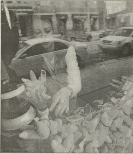
ბარჯ სიტიდან