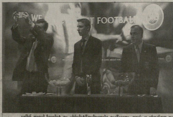
გუმინ უფვა ჩვიდმეტ და ცხრაიმეტწლამდელები დააწვილა, ღლეს კი ეროვნულ და ხალბარულ გუნდებს უკრის კენჭს

გუმინ ავსტრალიაში საქართველოს ვეე ხელბურთილი ნაერებს მხოლოდის 2003 წლის ჩემპიონატზე თამაშის უკრივის იმდეც კადუნურა ქალაქ ტრარში გამართული შესარჩევი ეტაბის მესოეე ტურის მტრმა მასხინძლემს ჩვენებურეხი 30:21 დაბრდიეს. ქართველებს რა? იმდე და იტყვა.