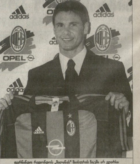
ფერინალი რენდობის „მელანტი“ მისურის ხანის არ დღისია

რეგარბილ კვლავ ნაბრებს მიღვა ღარბი. ლეონი ფაღვიე საწოლარი და ზრახილის ნარებს კორეა-იაპონიისთვის მხადების იმით ირეებს, რომ ქალევი ფორამში ბილიეულებს ამხანგურად გაუბებება ადმა ფილიე“ პირველ საწერინელ მატჩში ლევიორეობზე უარი თევა, ამიტომაც ტრინალისა და ადლიაბობი ვერნალისტები ბილიეულების წინააღმდეგე 1994 წლის მსოფლიოს ჩემპიონატის ვამობის, რომარის ვამბობის ელიდენე. ამეც ოციმოცეტხმის მალეული თავდამხმელი კარგე ხანია, რაც ვეიდელ მისურის მორეგებას ელიდობს, ერთეული პირველობის საეკეთისი მუგოლოცია ასაციის მუღევეად, ერთეული საეკეთისია, მარამ მწერინელი რატეობეც არ სწელებს. ზრახილეობა უენარბათ თაკეცის რომარის ნარებს მალა დატრეება ასე ამხანგ.