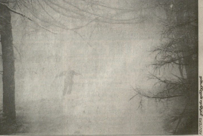
REUTERS კორტინა დამპეკოდან

ეული მთისხილაშურე ნისლი: აი, რა დატოვა უამსნდობამ ქალთა მსოფლიო ოპის გათამაშების სავარჯიშო სეზონიდან. გაბიჭულ იტალიურ სამთო ალატ კორტინა დამპეკოში შეკაბი ისე იწყება, ვიოთებს ხეირიანად არც უვარჯიშით.