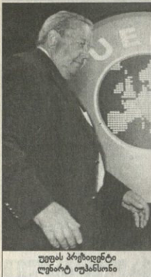
უესას პრეზიდენტი ლინარტ ტუასოსონი