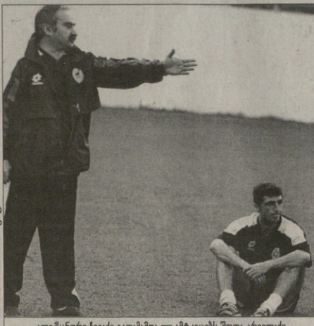
ალექსანდრე ჩიხაძე გათამაშდა — ამერიკის შოთა არგველი

ალპარტო ქართული მუსიკის ერთ-ერთი უმთავრესი სახელია. მისი მემკვიდრეობა მსოფლიო მუსიკის ისტორიაში უკვე დასაბუთებულია. მისი მემკვიდრეობა მსოფლიო მუსიკის ისტორიაში უკვე დასაბუთებულია. მისი მემკვიდრეობა მსოფლიო მუსიკის ისტორიაში უკვე დასაბუთებულია.