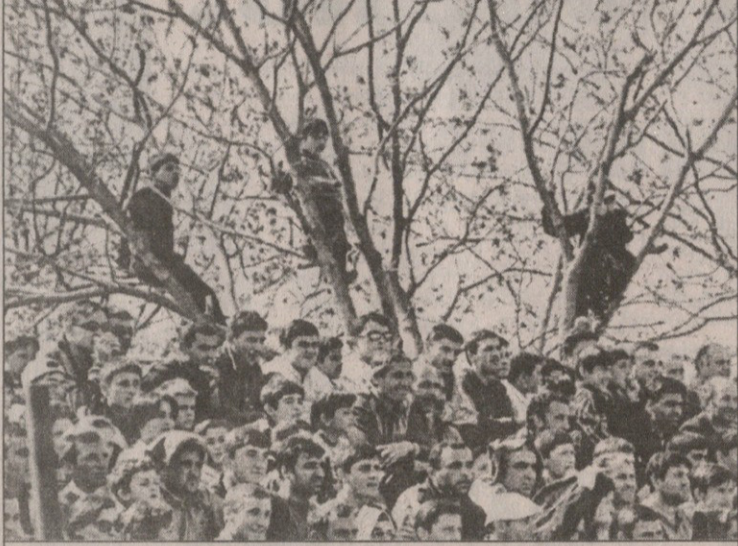
ზესტაფონში წინორელ ქომავებსაც ელიან