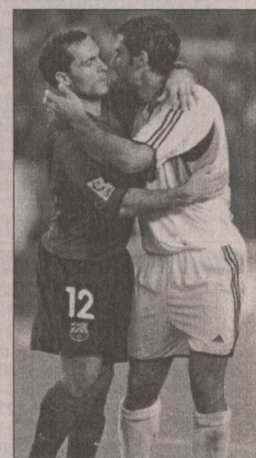
პირველი წრე ბარსელონა — რეალი. რეალი იჭით, ფიგო კოკუ (№8) ატეო სერხი და ფიგუ ერთმანეთს ძლიერად დასცილდნენ

იხილეთ დავიწყობი, რთაც ამ ხუთი თვის წინ, უფრო ზუსტად კი შარშან, 22 ოქტომბერს „ბარსელონა“ — „რეალის“ მ- ტჩის შემდეგ დაგასრულეთ მამნ მადრი- დელმა ქომაგებმა დაქაფნეს ჩამოვა „ბარ- სელონა“ მადრიდში და რეალს დახვდუ- ბით, ნახავსო თუკი გავისწიებთ, როგორ დახვდნენ ბარსელონელი ქომაგები „რეალს“ და ლუიშ ფიგუს, ძელი მისსვედრი არაა, რასაც გვმაგენ დღეაქალაქელმა.