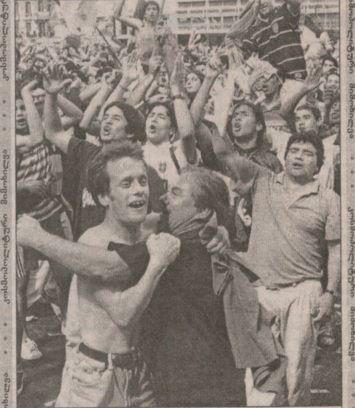
...და მერე 216 ადამიანი მონტეტეტოს ქუჩებში გავიდა

დეკარტე იუმორის გრძობა. მოკვნილი დასახურებდა