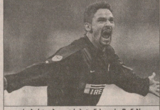
რობერტო ბაჯო ტრაპატონის თავს აწონებს

ბაჯოს იაპონიაში წასვლის შესახებ დაახლოებით ერთი კვირის წინ ალაპარაკდნენ. ამის შემდეგ რობერტომ სერია A-ს მორიგ ტურში ჩინებულად თამაშა და „ფიორენტინას“ ორი გოლი გაუტანა, 31 წლის ფეხბურთელი ტურის სიმბოლურ ნაკრებშიც შეიყვანეს.