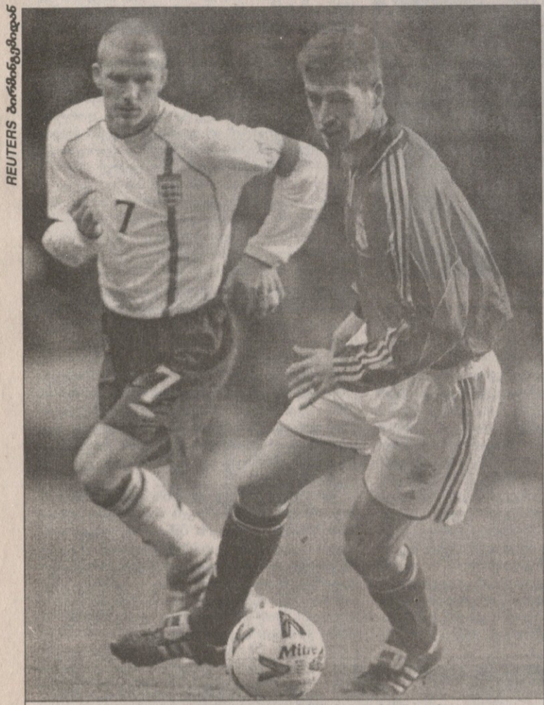
ერისკონის ინგლისური და ბექემის სამკლავრის დებიუტით ნაერების ახალი კაპიტანი ესპანელი ერისკონის წინამძღვრად