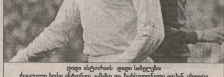
დიდი ისტორიის დიდი სახელები: რეალელი ხოსე ანტონიო კამაჩო და ბარსელონელი იოჰან კრუფი

მაგრამ რატომ ვლაპარაკობთ ასე და- რწმუნებით „რეალის“ გამარჯვებაზე? ეს თორმეტქულიანი სხვაობა ხომ მხო- ლოდ მადრიდელთა სურვილია? „სამეფო კლუბს“ ლახარეთში ოდენ ფლავიო კონსისაო ჰყავს და ამასაც რა ხანია შეეჩვიეთ. სხვა მხრივ კი „რეა- ლში“ სრული წესრიგია — გუნდს და- ურუნდნენ ფერანდო მორინტესი და სტივ მაქმანამანი, ლუიშ ფიგუსაც „სან-