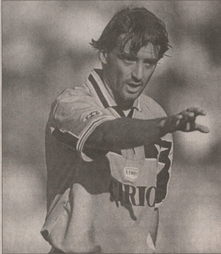
რობერტო მანჩინი ფლორენციაში დიდ პატივში

ცდათიან წლებში „ფიორენტინას“ ჭაბუკთა გუნდში მუშაობდა. თვით რობერტო მანჩინი კი მომავალ შეგირდებს მართო სკონჩერტისთან ერთად საკვირაო მატჩში ტრენინგებიდან დააკვირდებოდა: „ის ჩემი სტუმარი იქნება ბარიში, ამასობაში მის ადგილს დროებით ლუჩიანო ჩიარეჯი დაიკავებს“ — საყოველთაო პატივში ჰყავთ ფლორენციელებს მანჩინი.