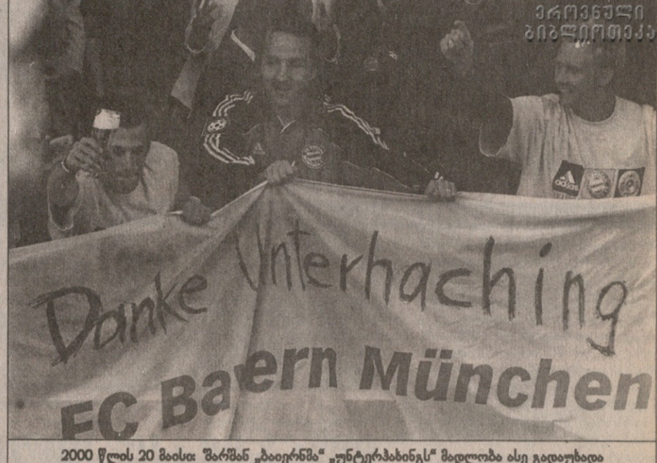
2000 წლის 20 მაისი: შარშან „ბაიერნი“ უნტერჰაჩინგს მადლობა ასე გადაუხადა