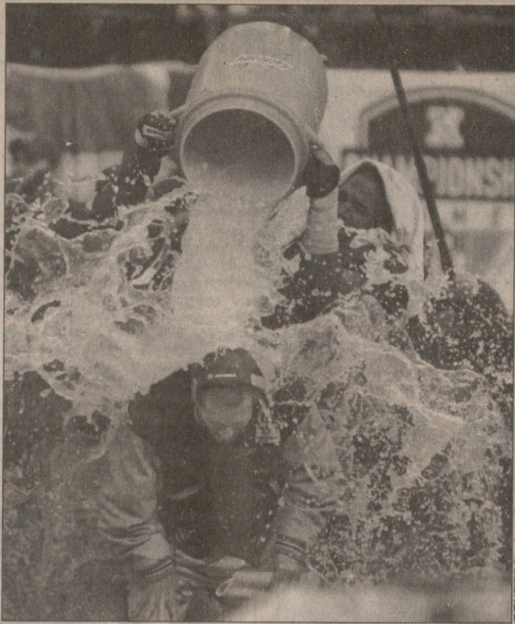
ისტ რუტერფორდიდან