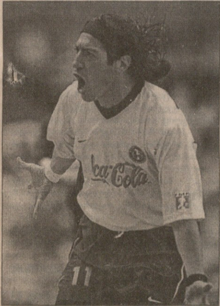
სამორანომ „ამერიკა“ ჰუთ თორიქით გაახარა