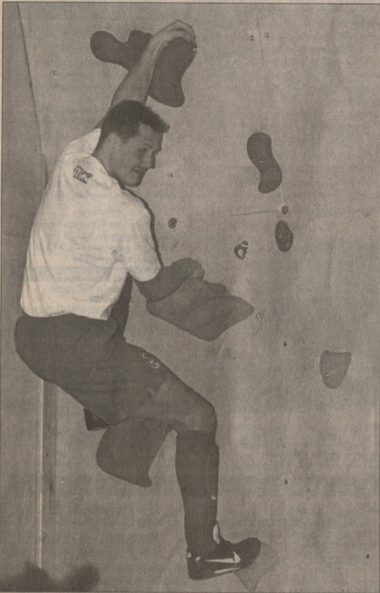
მადონა დი კამპილიოდან

დოლომიტის ალპებში, განთქმულ სამთო კურორტ მადონა დი კამპილიოში გრძელდება „ფერარის“ გუნდის შოუ-არდადეგები ფოტორეპორტიორების თანხლებით. ციგაობასა და თხილამურებით სრიალთან ერთად, განთქმული მრბოლები შეკვდიან ვარჯიშობენ. აგე, მიხაელ შუმასერი საეარჯიშო კედელზე მიბობღაგს.