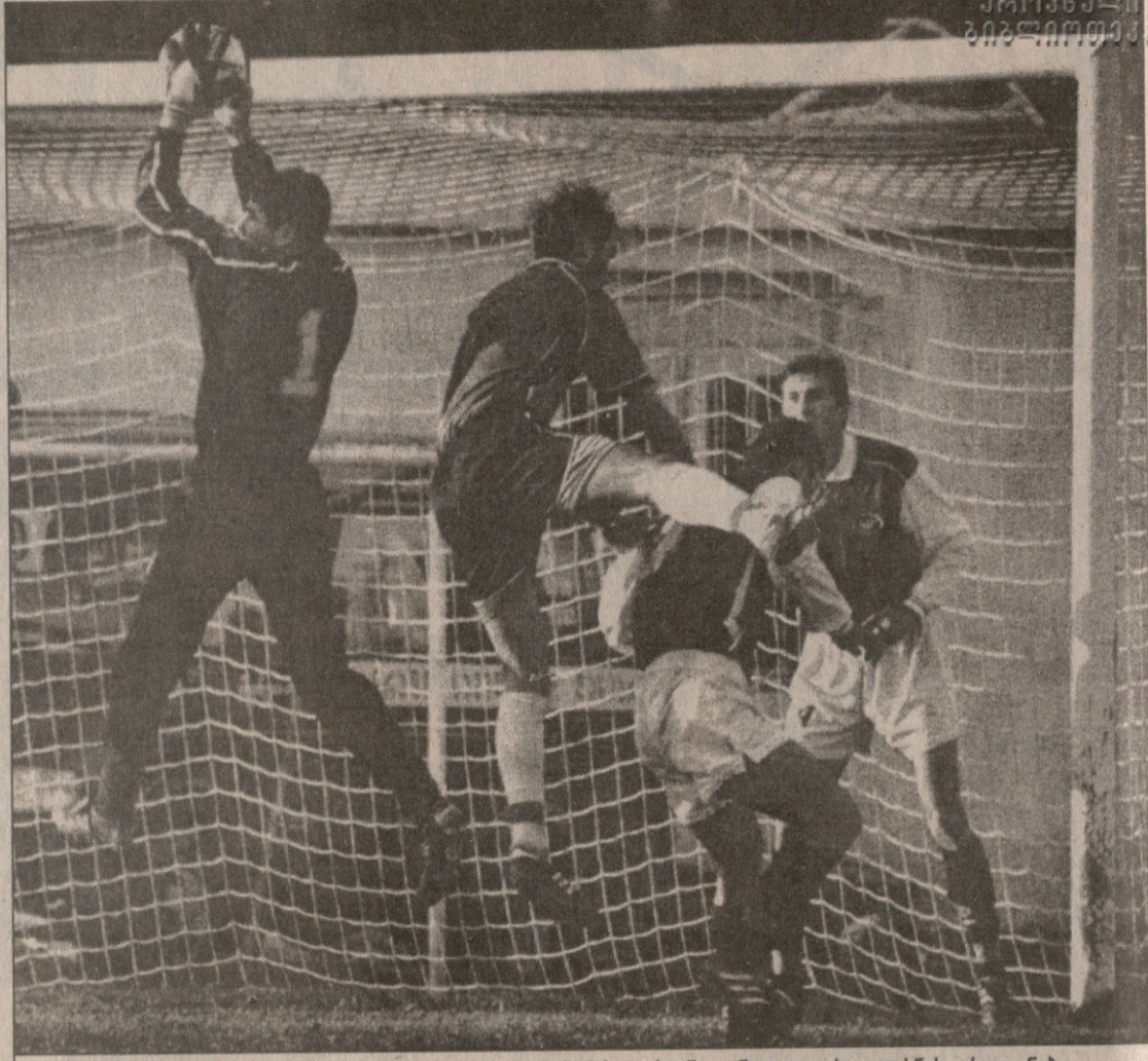
ვითვალთ თუ ვინაა მერლანმა ბურთი მერანის უკრაინელ ნიკოლაი პოლენსის არ დაანება

მოს“ მატჩის გმირმა გადელამ დაიწყო. ქუთაისის „ტორპედო“ მივლინებით მეორე თამაშს არ წააგებსო, ვიწინასწარმეტყველებო და ისე ყველაფერი კარგად ავიხდებო, როგორც ნათქვამი აგვისრულდა. რიონისპირელებმა სამი ქულა ისე ჩაიჯიბეს, რომ სტუმართა გამარჯვებაში ეჭვი მასპინძლებსაც არ შეჰპარვიათ.