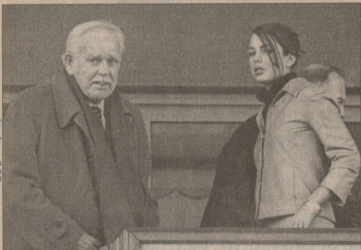
REUTERS მონტე კარლოდან

თუკი საფრანგეთის ჩემპიონატის მე-16 ტურში „მონაკომ“ „პარი სენ ჟერმენს“ 2:0 მოუგო, ხოლო სტადიონზე თავისი გუნდის საქთმავოდ მონაკოს პრინცი რაინერი და პრინცესა კაროლინას ქალიშვილი (მართლმად?) შარლოტი მიბრძანდნენ, რამდენია ალბათობა იმისა, რომ აი, თქვენ მათ ადვილზე შეიძლებოდა დაბადებულიყავით, ისინი კი თქვენსაზე?