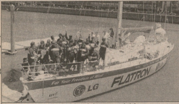
„LG ფლატრონი“ — პირველი და გახარებული

ბოსტონში პისტოლეტის (თუ სხვა რამ სასროლის) გავარდნიდან 32 დღე-ღამეში, 22 საათში, 13 წუთსა და 37 წამში „LG ფლატრონი“ ბუენოს აირესის ნავსადგურში მოწყობილი ფინიში გადალახა. გასავათებულმა ზღვაოსნებმა, რომლებიც თავისი სახელის „BT ჩელენჯერზე“ განსაზღვრულად სახელოვანმა ფირმა „LG“-მ დაქირავა, სიხარული უცებ გამოხატეს და მონატრებულ ნაპირზე ფეხი იმ დიდებული შერეობებით შედგეს, რომ საერთო ჩათვლის პირველი ადგილიც ორი ეტაპის შემდეგ თითქმის განადლებული აქვთ: საუთჰემპტონიდან ბოსტონამდე მათი გამსწრებნი, „BP“ და „ქუალსტონი“ ცხრილის სადაც მუაგულის იქით მოცურავდნენ და არც ფინიშზე აპირებდნენ ფრთების შესხმას. ასეც მოხდა — მეორე ნაპირს „სპირიტ ოფ ჰონკონგმა“ მიაშურა (მთელი 15 საათის შემდეგ), მესამედ კი ნავსადგურში მდგომმა მოსიერიებმა „ლოჯიკი“ იხილეს,