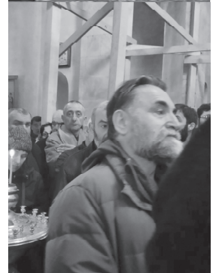
გუგუნებდა, წმინდა მეფე ჩრდილად დასდგომოდა საქართველოს...