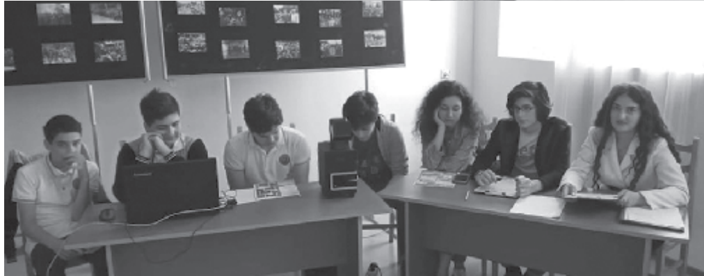
ამაში ღონისძიების მიმდინარეობისას.

დარბაზს სულისშემძვრელი პანგები ეფინება. ახალგაზრდებმა ზედმიწევნით სიზუსტით, არგუმენტირებულად ისაუბრეს იმ ეკლესია-მონასტრების, კულტურულ-საგანმანათლებლო ობიექტების შესახებ, რომლებზედაც გარემოებათა გამო, დროებით საქართველოს სახელმწიფოს იურისდიქცია ვერ ხორციელდება. შეგვახსენეს ქართულ-აფხაზეთი მეგობრობის, სტუმართმოყვარეობის გაუხუხარი მაგალითები, ისაუბრეს საქართველოს ამ თვალწარმატები კუთხის ფლორასა და ფაუნაზე, რეგიონის ისტორიაზე, სინანული გამოთქვეს 1993 წლის 27 სექტემბერს სოხუმის დაცემისა და საერთოდ 13 თვინი და 13 დღიანი ომის საშინელებებზე, მამულს ომანიანად, ეჭვშეუვალად შეჭვიცეს სიყვარული. მზაობა გამოთქვეს თავიანთი წვლილი შეი-