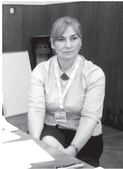
კენჭისყრის შედეგების შემავალი ოქმის შედგენა და საჯაროობა; კენჭისყრის დღის განცხადება-საჩივრები”.

იმნაძემ სასწავლო პროგრამის შესახებ ისაუბრა: “სასწავლო პროგრამაში გამოყენებული პრაქტიკული სწავლების ფორმატში მონაწილეები გაეცნობიან ისეთ მნიშვნელოვან საკითხებს, როგორებიც არის: დემოკრატიული საარჩევნო პროცესის სახელმძღვანელო პრინციპები, მათ შორის, ხმის მიცემის ფარულობის პრინციპი, საარჩევნო ადმინისტრაციის სტრუქტურა, საარჩევნო მოხელის საქმიანობის სახელმძღვანელო პრინციპები, ეთიკის კოდექსი, საუბნო საარჩევნო კომისიის საქმიანობა კენჭისყრის დღემდე პერიოდში. საუბნო საარჩევნო კომისიის განხილვა და კენჭისყრის დაწყებამდე ჩასატარებელი პროცედურები; კენჭისყრის პროცესში საუბნო საარჩევნო კომისიის წევრთა მიერ ფუნქციების შესწავლა და ხმის მიცემის პროცედურა; კენჭისყრის მიმდინარეობისას პროცედურული რისკების იდენტიფიცირება და რეაგირება; ამომრჩეველთა პერსონალური მონაცემების დაცვა; საარჩევნო უბნის დახურვა;