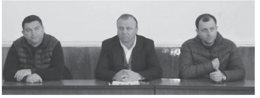
მის ფარგლებში უნდა განხორციელდეს და მერიის შესაბამისი სამსახურებისა და ქალაქში, დაბასა და სოფლებში მერის წარმომადგენლებს შესაბამისი და-