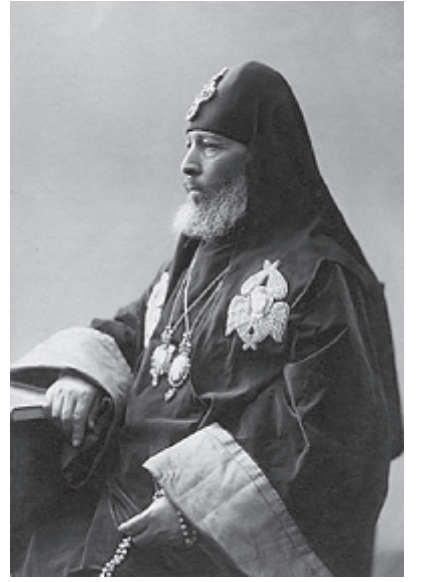
ელმოწამე კირიონის ხსენების დღე.

2003 წლის 10 ივლისს პირველად აღინიშნა საქართველოში წმინდა მღვ-