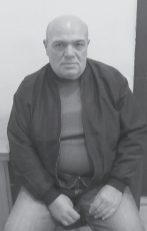
– ამ დროს ოჯახებს გარდაცვლილები ჰქონიხართ?