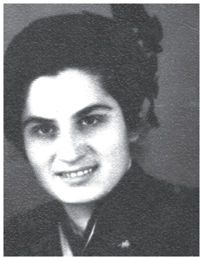
ერ მიტინგის დარბევის პროცესს.

მომღერალთა ჯგუფში ვიყავი და ამის გამო დასასჯელებლად შინ ცოტა ადრე მომიწია წასვლა. დაიღუპა ათობით ახალგაზრდა, მათი ცხედრები მტკვარში გადაყარეს, რამდენიმე ჭირისუფალმა შეძლო მხოლოდ მიცვალებულების დატერება.